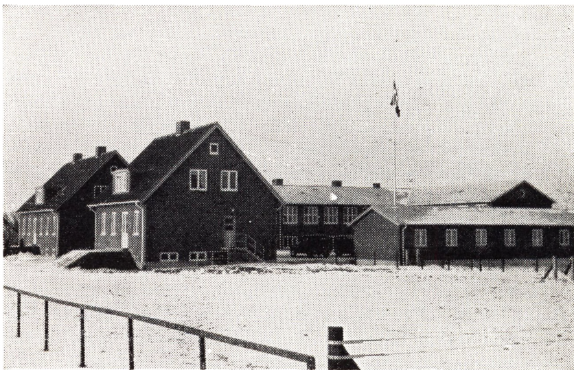
Vallengsved centralskole, indviet 1. januar 1940