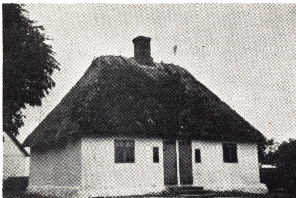
C. A. v. Plessens skole i Vallensved, opført 1724.