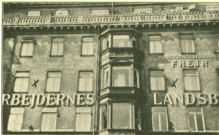
Vesterbrogade 5 A, København.