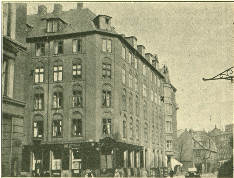
Gammel Kongevej 70, Frederiksberg.