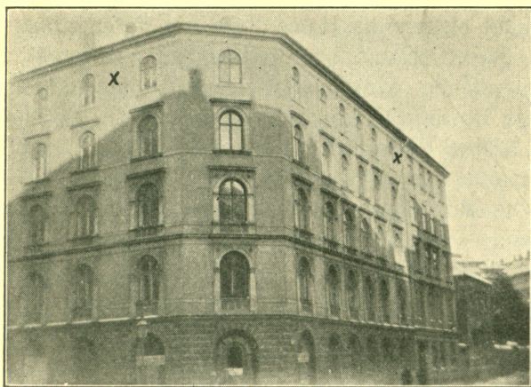
Tordenskioldsgade 5, København.