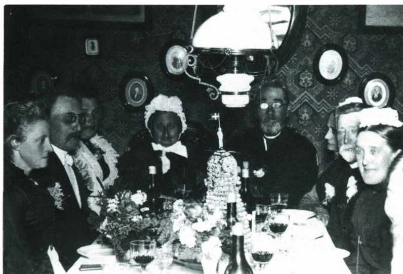
Sorvads Guldbryllup 1. Oktober 1902