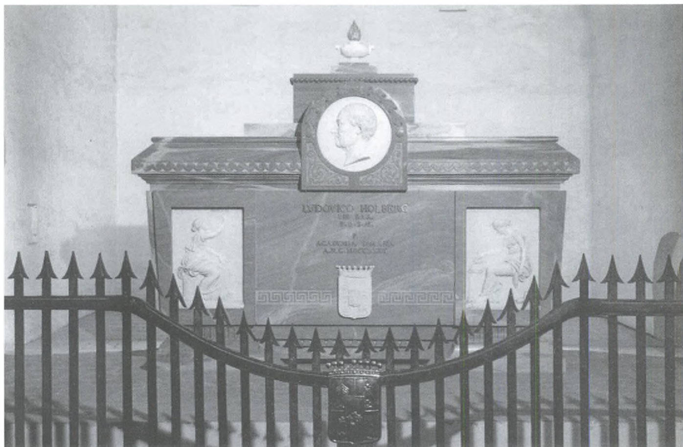
Holbergs sarkofag i Sorø Klosterkirke.

I 1747 testamenterede Holberg sine ejendomme til Sorø Akademi, og for at holde godserne samlede fik han oprettet "Baroniet Holberg". Samtidig blev han ophøjet til friherrestanden. Men for Sorø Akademi var det svært at vente på, at baronen skulle dø, så et par år senere fik akademiet alle baroniets årlige indtægter. Til gengæld fik Holberg ret til fri begravelse inde i Sorø Kirke, når han engang døde. Og i Sorø Kirkes kapel ved nordre korsarm hviler Holberg den dag i dag i en stor sarkofag, der er tegnet af Wiedewelt. Sarkofagen står bag et jerngitter, der er smykket med en nitakket grevkrone, selv om baroner strengt taget kun har ret til en syvtakket krone. Holbergs død blev omtalt i den daværende Berlingske Tidende den 28. januar 1754: "Udi sidst afvigte nat klokken 1 slet blev vor store og udødelige hr. baron Ludvig Holberg, efter en langvarig svaghed, ved den timelige død i hans alders 70. år, til ubodelig forlis for videnskabernes, bortkaldet fra denne verden."