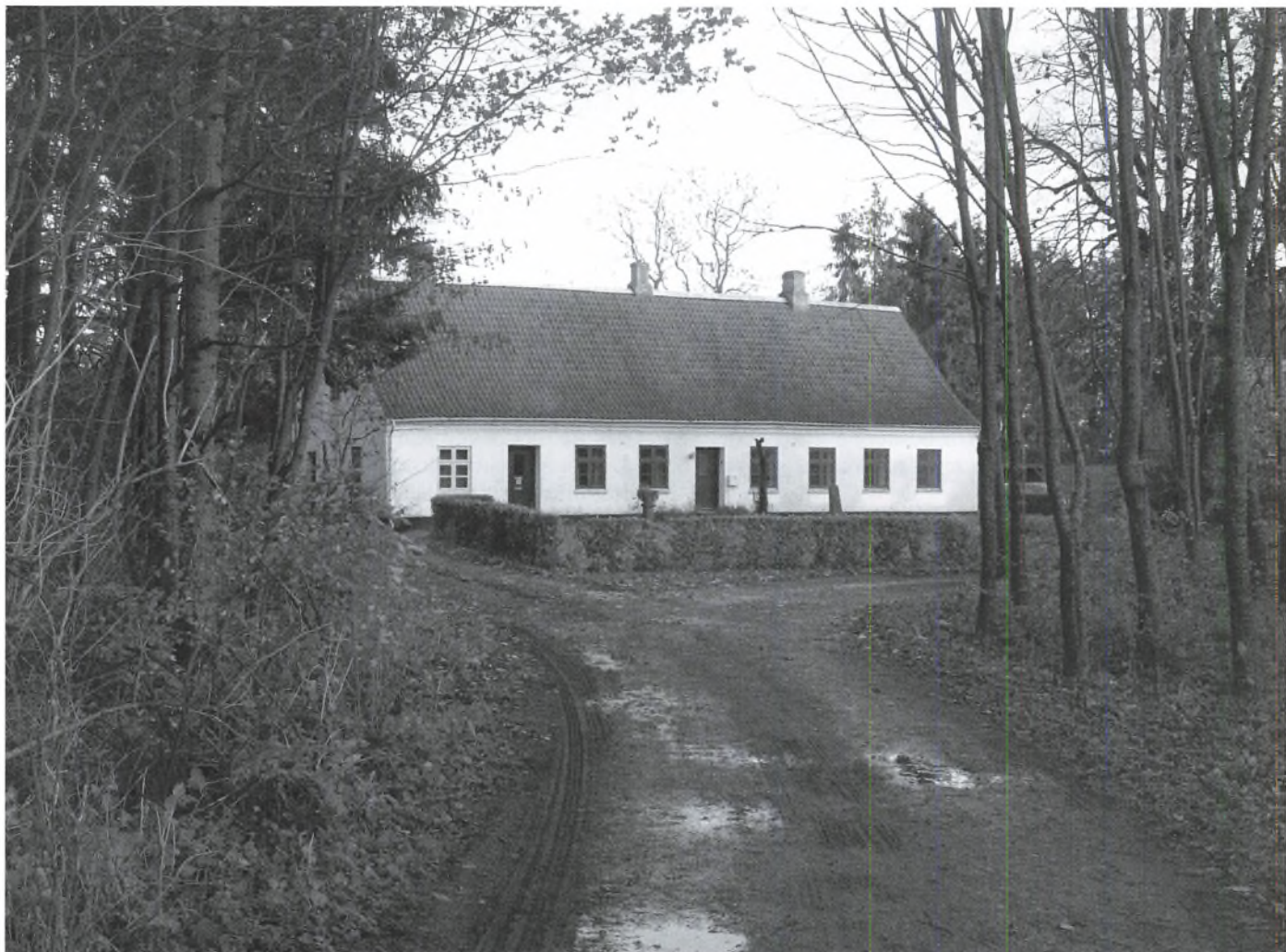
Stedet, hvor Brorupgård lå, da Holberg besøgte den. Det hvidkalkede hus står på fundamentet af hovedbygningen, hvor Holberg residerede nogle somre.

gers og spisekammer. Under køkkenet var der en kælder. I hele huset var der kun 2 kakkelovne, såkaldte toetages vindovne med rør og tromle. Her kan vi forestille os, at Holberg har siddet og arbejdet med de bøger, han udgav i disse år: Niels Klim 1741, Noter til den jødiske historie 1742, Tredje levnedsbrev 1743 og Moralske tanker 1744.