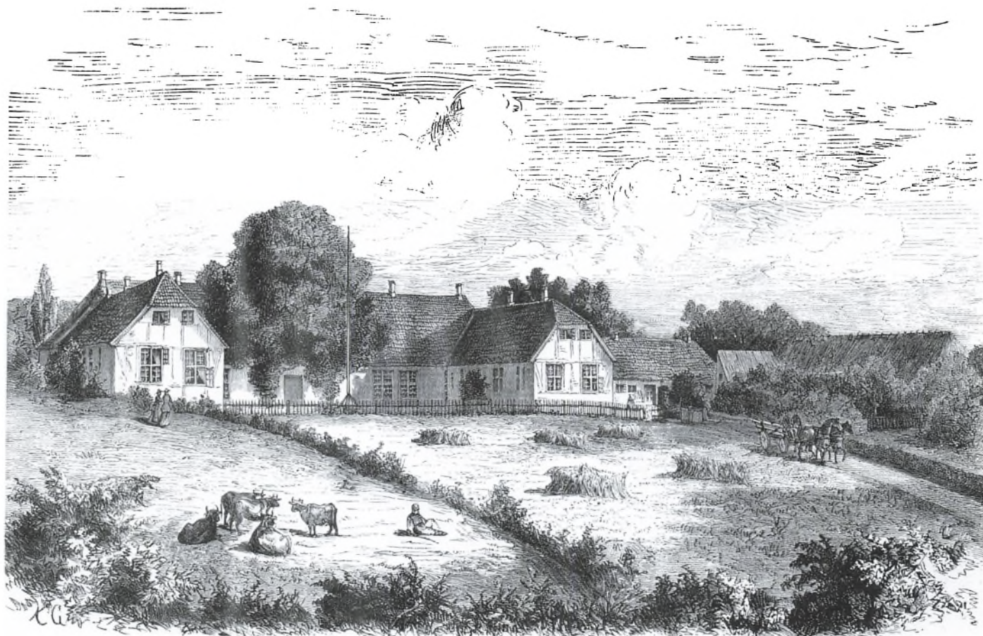
Tersløsegård. Hovedbygningen ser ud, som da Holberg ejede den.

På Brorupgården havde Holberg en ridefoged, som opdrættede sine egne stude i gårdens stalde, ligesom han også drev ulovligt krohold. Han blev naturligvis afskediget, da Holberg opdagede det, og Holberg sagsøgte ham med krav om erstatning. Men den tids dommere så mere på, hvem der havde råd til at betale, end på, hvad der var retfærdigt, så Holberg tabte sagen og måtte yderligere betale 600 rigsdaler. Også kvægpesten gav Holberg store tab. Alene på Brorupgården døde der 69 kreaturer i 1750. Holberg skrev: "Alle mine køer er mig rent bortdøde, men min genbos lænkehund, som jeg ofte har besværet mig over, efterdi