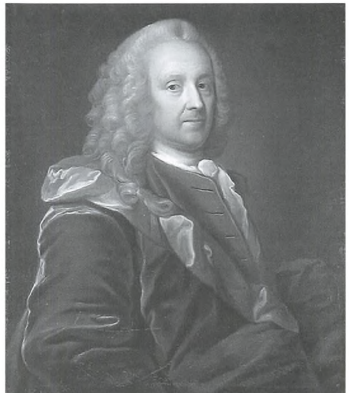
Ludvig Holberg (1684-1754). Som ung forfatter skrev han flere komedier om adelsgale borgere, og på sine gamle dage blev han lensbaron.

Straks efter købet bortforpagtede Holberg Brorupgård, men han betingede sig "at kunne bebo de tvende østlige værelser i det røde borggårdshus". Huset var kort og bredt, 15,5 x 11 m. Det var grundmuret af røde sten eller rødkalket, og det havde stråtag, dog med tegl i tagskægget. Der var 16 vinduer med små blyindfattede ruder. Der var indgangsdør mod syd, ud mod gårdspladsen, og herfra har der været en storslået udsigt mod Slagelse med dens møller og kirker, og til Antvorskov Slot, hvis kirkespir var over 73 m højt. Mod nord var der udsigt over Tudeå til Torsmarken, hvor der dengang stod en nyopført stubmølle. Huset var indrettet med en stor ottefags stue, en gæstestue på 2 fag og et lille kammer. Der var dagligstue, køkken, bryg-