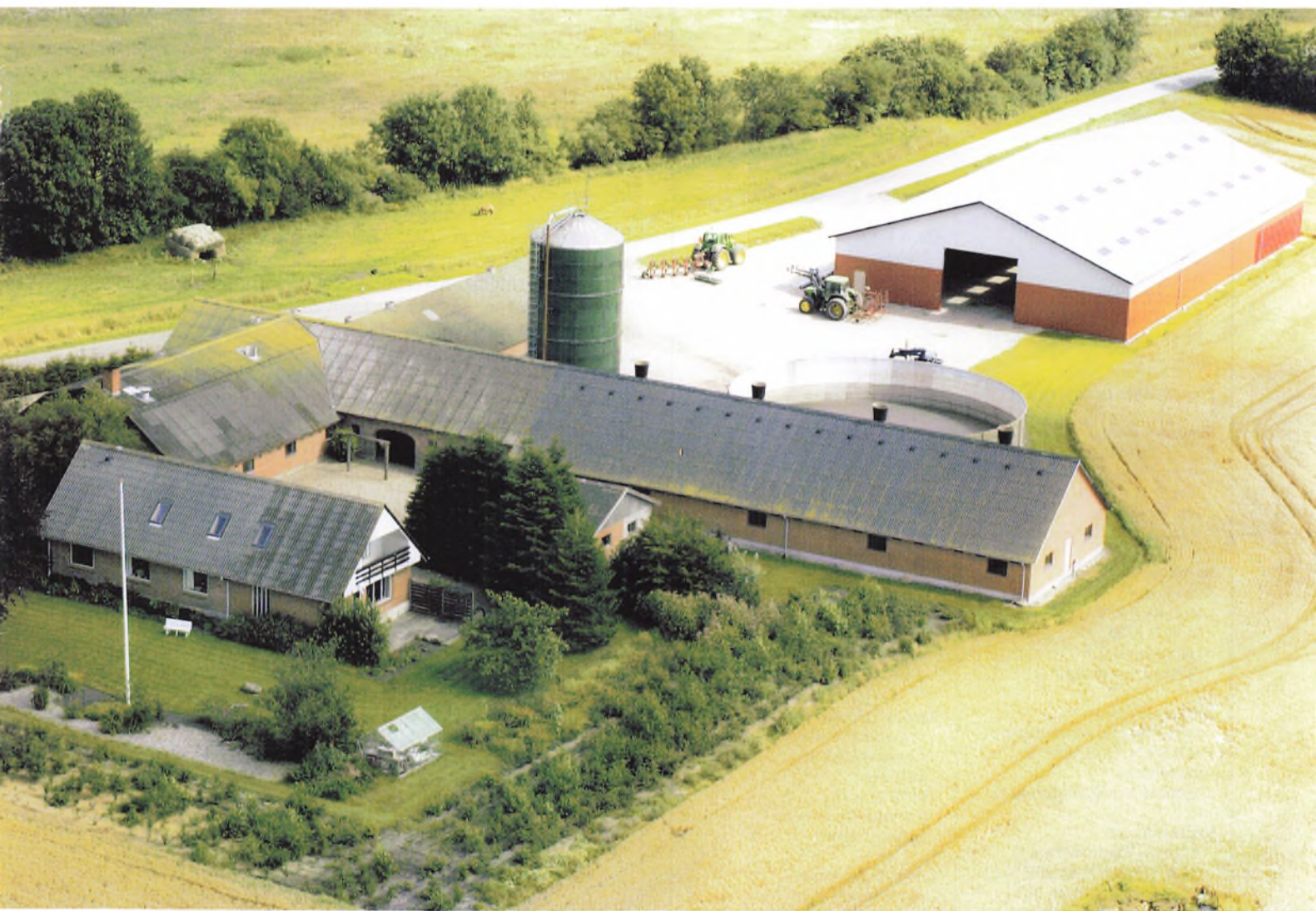
Brogård ved Ølgod