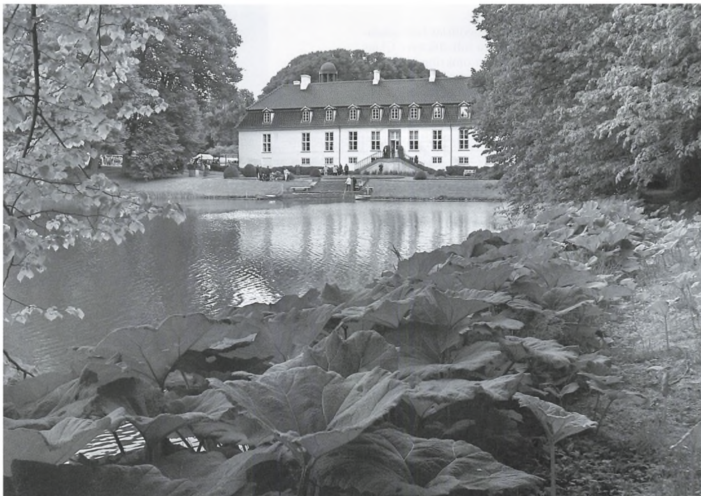
Sydfløjen på Glorup