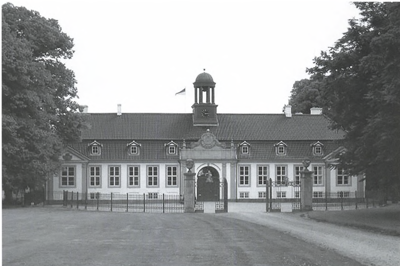
Portfløjen på Glorup

Den gamle sædegård i Svindinge sogn på Østfyn – Glorup – bliver første besøg på årets fortur.