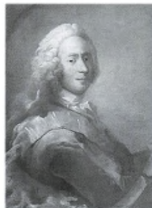
Adam Gottlob Moltke