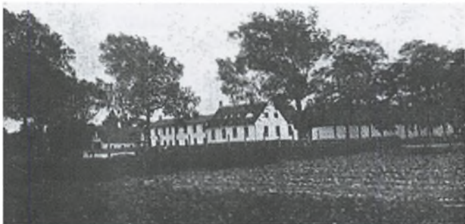
Flakkebjerg Institut ca. år 1911

"Anstalten" indviedes 31. august 1836 med 9 elever.