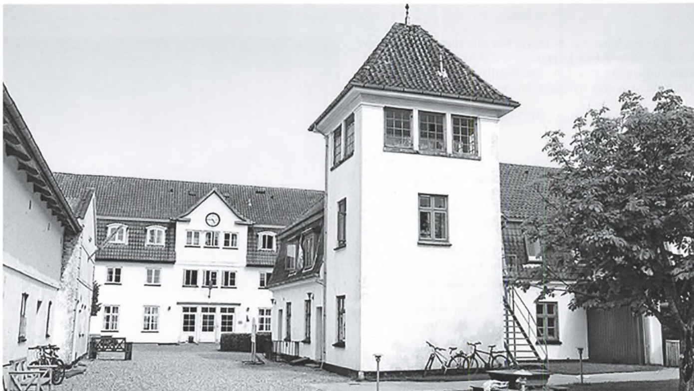
I vore dage huser bygningerne Flakkebjerg Efterskole

Da Flakkebjerg Ungdomshjem blev oprettet i 1836 hed det "Flakkebjerg Institut til moralsk fordærvede Drenges forbedring", senere ændredes det til "Flakkebjerg Opdragsanstalt og i de sidste mange år hed det "Flakkebjerg Ungdomshjem". Anstalten begyndte som et opbevaringssted for forsømte drenge, og i løbet af 1900-tallets første halvdel udviklede den sig til Danmarks første erhvervsskole.