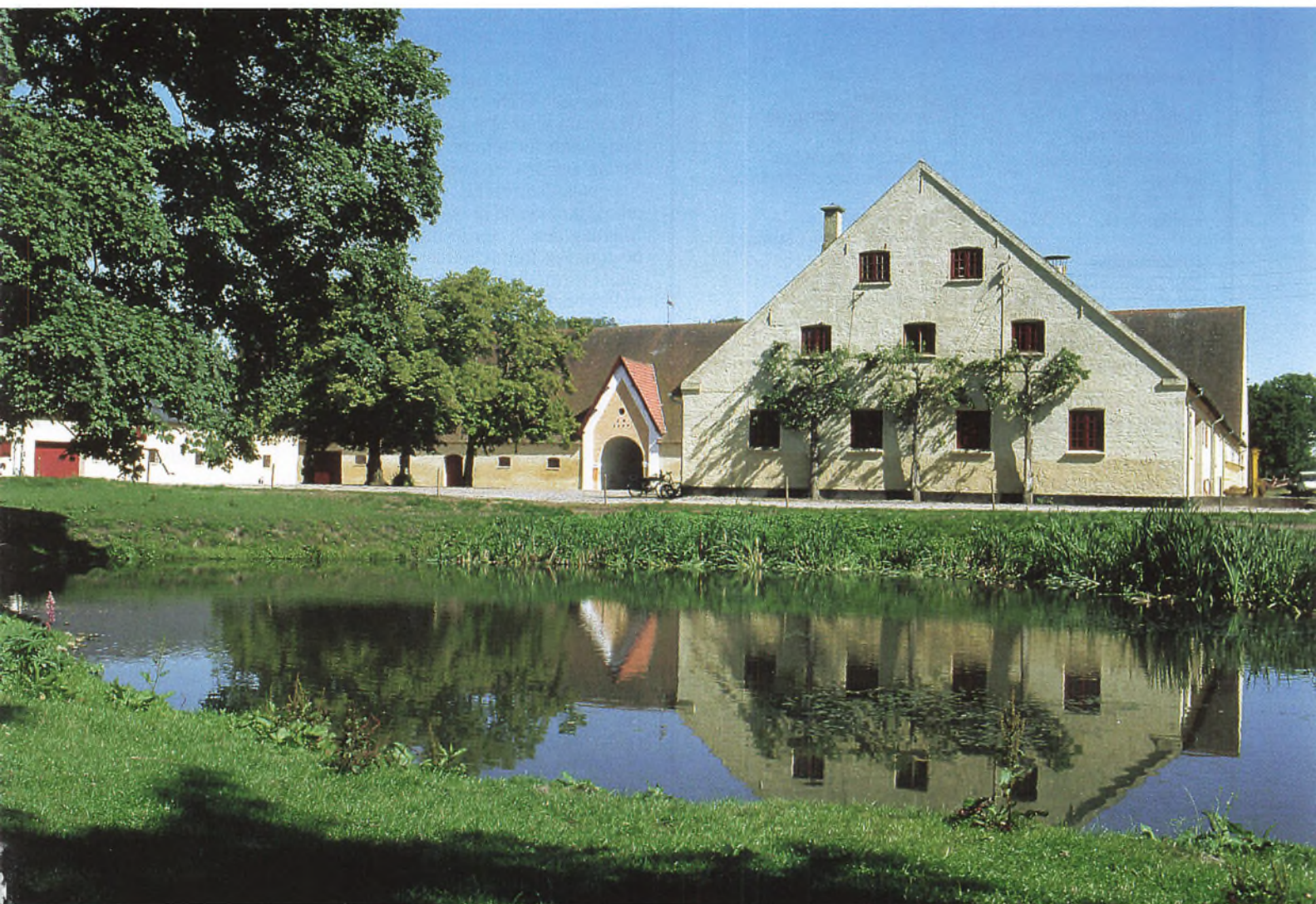
Avlsgården til Kærsgård hovedgård, som rummer transportmuseet.