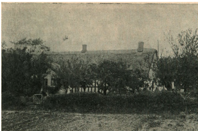
Anneksgaarden i Stilling, set fra Haven, nedbrændt 1925.