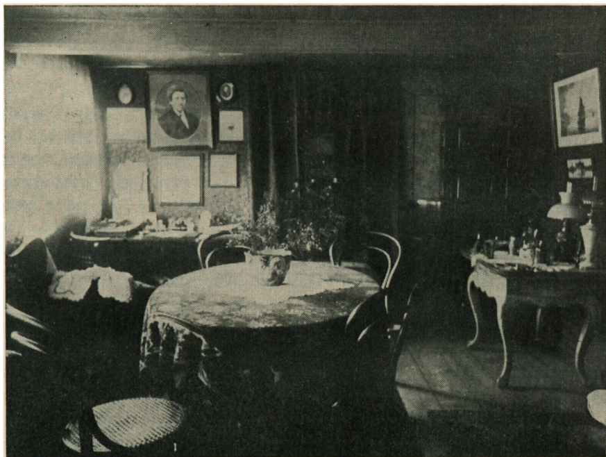
Dagligstue i Slægtsgaardens gamle Bindingsværks-Stuehus. Bemærk Loftsbjælkerne. Fotografiet er taget kort før Gaarden flyttedes ud paa Marken.

Tøjrene, saa lod de sig slæbe, indtil vi fik Benet af Tøjret igen, og det kunde vedblive at gentage sig i det uendelige. Vi trak mange Faar ad Gangen, og naar de smaa nyfødte Lam skulde med og Moderen blev borte for dem, var der en forfærdelig Brægen, indtil vi igen fik dem sammen. Senere, naar Lammene blev større, og Faarene laa ude om Natten, var der ingen Vanskeligheder af Betydning, men snart kom den Tid, hvor Lammene vilde gaa ind i Kornmarkerne, saa det blev nødvendigt at hindre dem, og dermed kom Be-