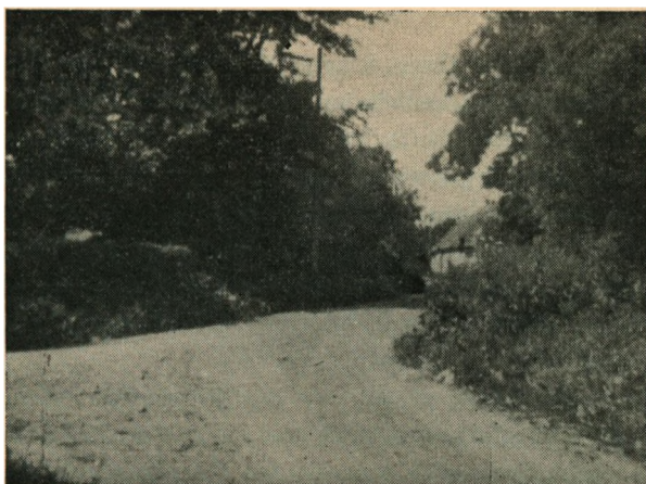
Indkørslen til Adslev fra Øst. Til venstre ses Hegnet om Slægtsgaardens gamle Have.