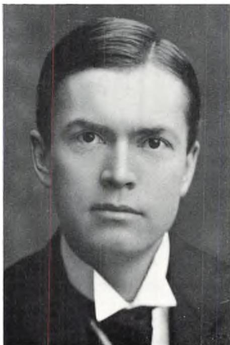
John R. Mott