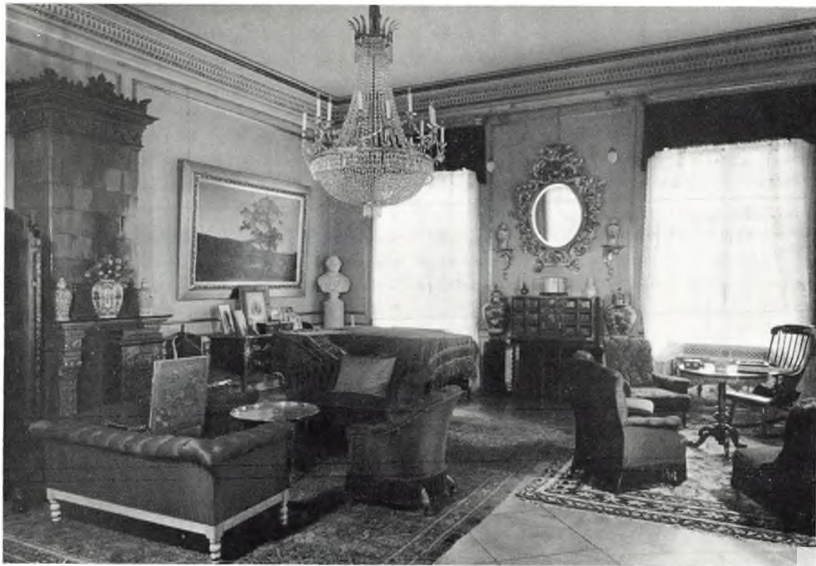
Hjemmet i Bredgade 41. Dagligstuen, hvor moderne blev holdt.