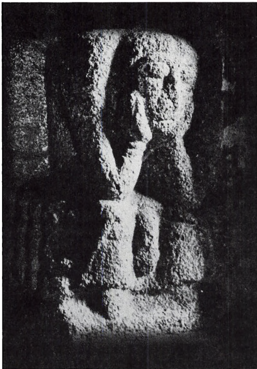
En stor mand fra romansk tid, bundet i sten som søjlebasis i Nørre Brarup kirke i Sydslesvig (Jane Bossen og Helge Krempin: Granit i Angel s. 32).

Romanske granitbilleder i Norden, der er tunge af køn og krop, afløses af kalkmaleriernes lettere, fortællende scener, hvor vi også ser mennesket i arbejde med jorden.