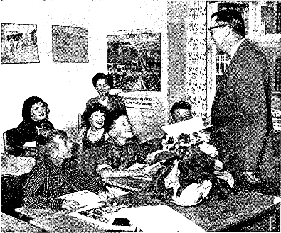
Den første skoledag efter statens overtagelse af skolen