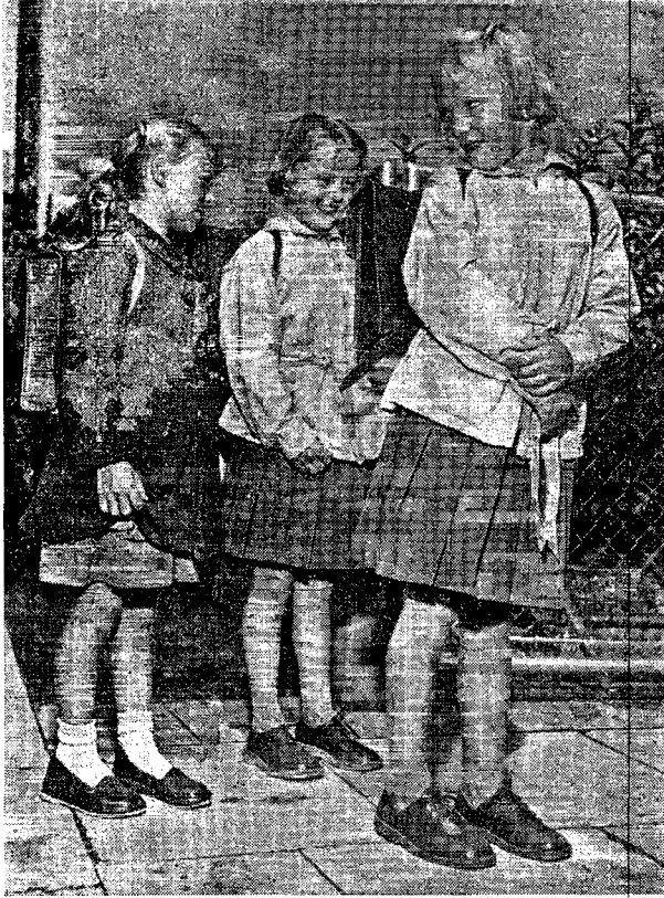
Den første skoledag