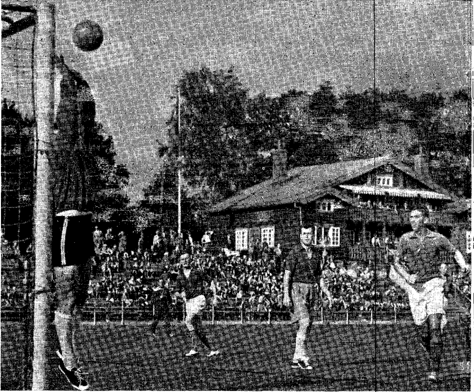
Den spændende kamp mellem lærere og elever