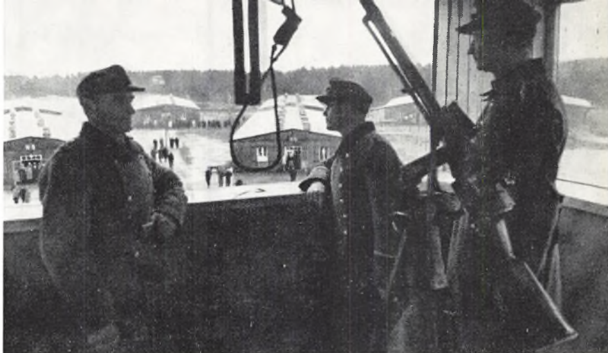
Tyske vagter i midtertårnet morgenen 5. maj 1945.