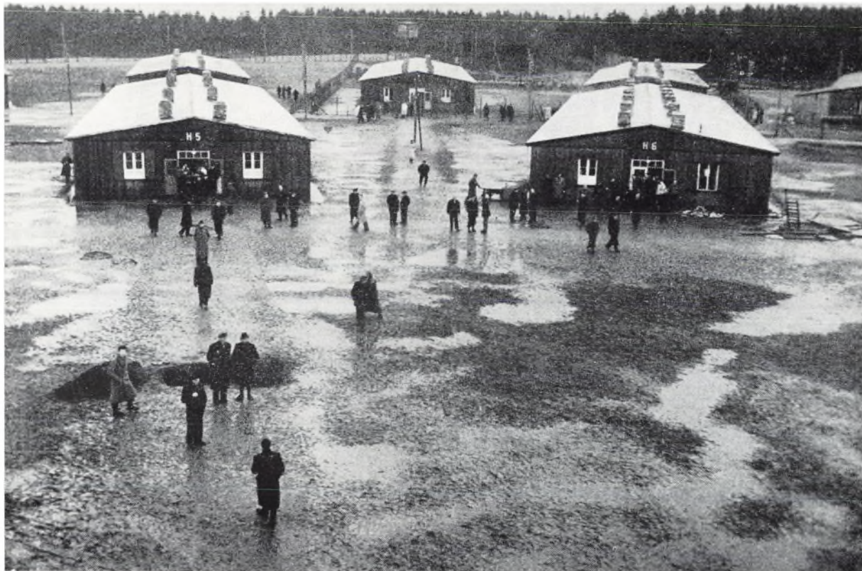
Udsnit af lejren set fra midtørtårnet i kapitulationsmorgenens regnvej 5. maj 1945.