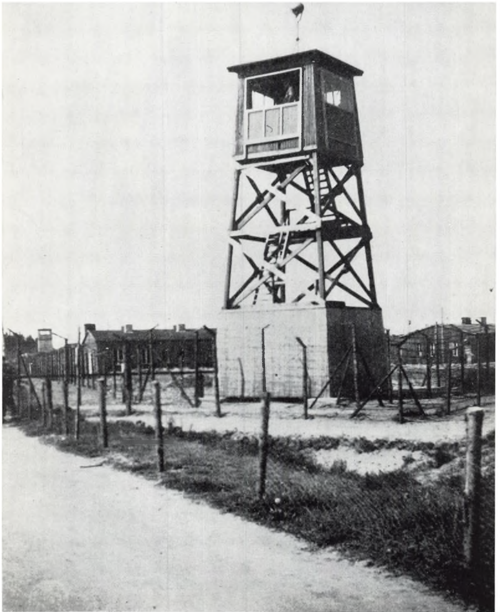
Vagtårnet ved lejrens sydlige port.