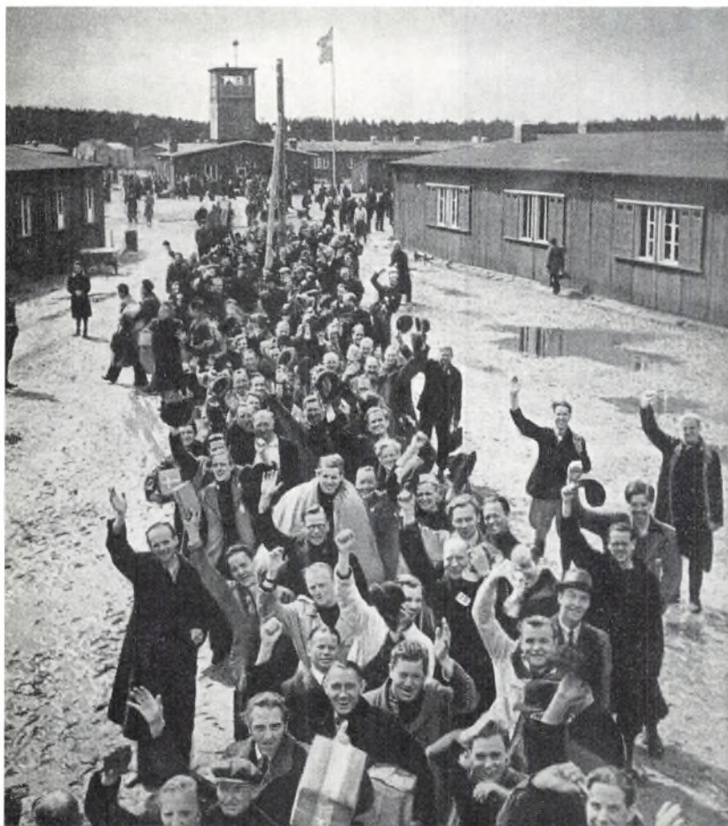
5. maj 1945. Befrielsens time.