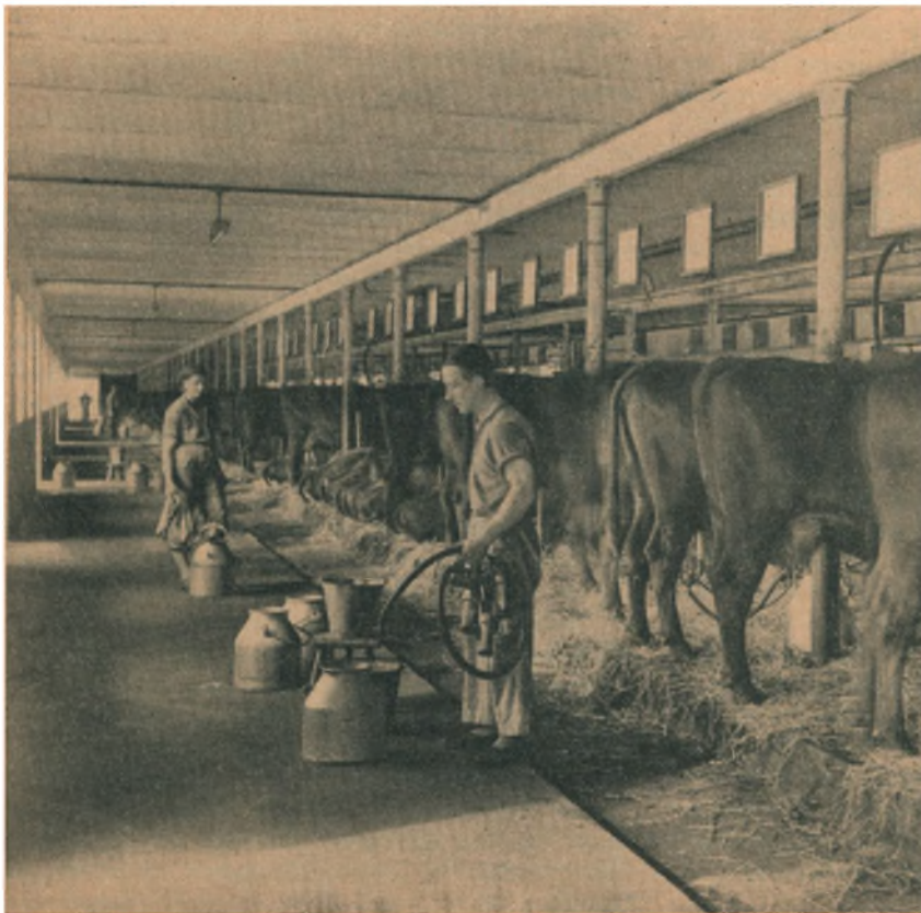
Staldinteriør fra Kalø Hovedgaard, Danmarks største Afkomsprøvestation. Billedet fra den lyse og velindrettede Stald er taget paa et Tidspunkt, hvor man netop er i Færd med at malke med Maskinen fra det jubilerende Firma Alfa-Laval.

Formanden afsluttede med en Tak til Mødedeltagerne, og Dirigenten rettede en Tak til Bestyrelsen for dens store og betydningsfulde Arbejde.