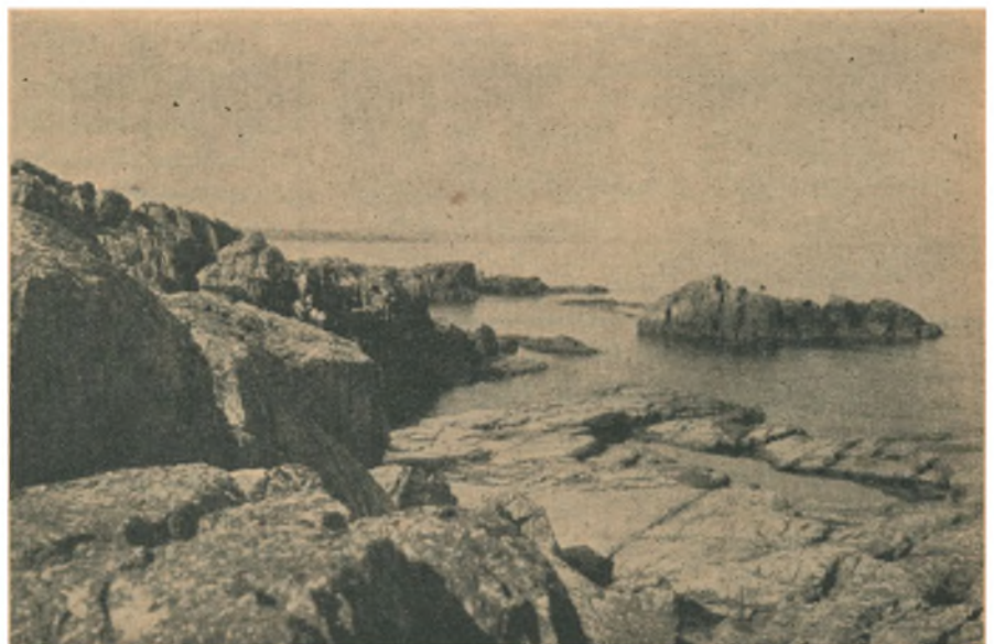
Maagestolene ved Gudhjem.