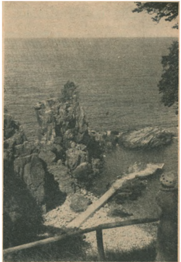
Ved Helligdommen, Rø.