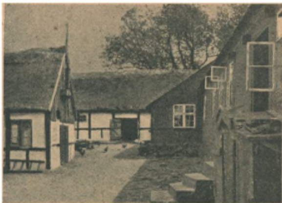
Gaardinteriør fra »Tornebygaard« i Klemensker Sogn.

og det kan skelligens bevises, bøde derfor til Lauget 2 Mark. Hvo som slaar sin Broder blaa eller blodig med Stang, Knippel, Sten eller Vognkæp, bøde derfor 3 Mark. Men gaar han saa vidt, at han »hugger, slaar eller stinger sin Broder med Væрге, Økse eller Kniv«, saa stiger Bøden til Lauget til en Daler, mens man nøjes med to Mark, hvis han »slaar sin Broder i Gildeshus, Gaard eller Vold Øreslag eller Haardrag«. Man tænker sig nok ikke i Nylarsker, at det skulde gaa saa vidt, at en Broder skulde dræbe den anden, men i Øster Marie Gildeskraa af 1554 hedder det: »Slaar nogen sin Broder ihjel, det Gud forbyde, give en Tønde Øl og vinde Lavet paany«, d. v. s. søge ny Optagelse i Lavet!!