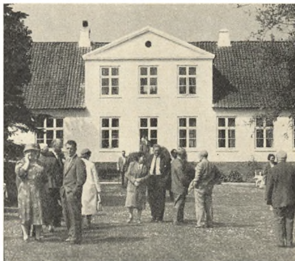
En del af »Gravendal«s stuehus.

Afgangen fra Ærø fandt sted med den nye færgе »Ærø-sund« kl. 16.40, og efter en ny smuk tur gennem øhavet takkede formanden over færgens