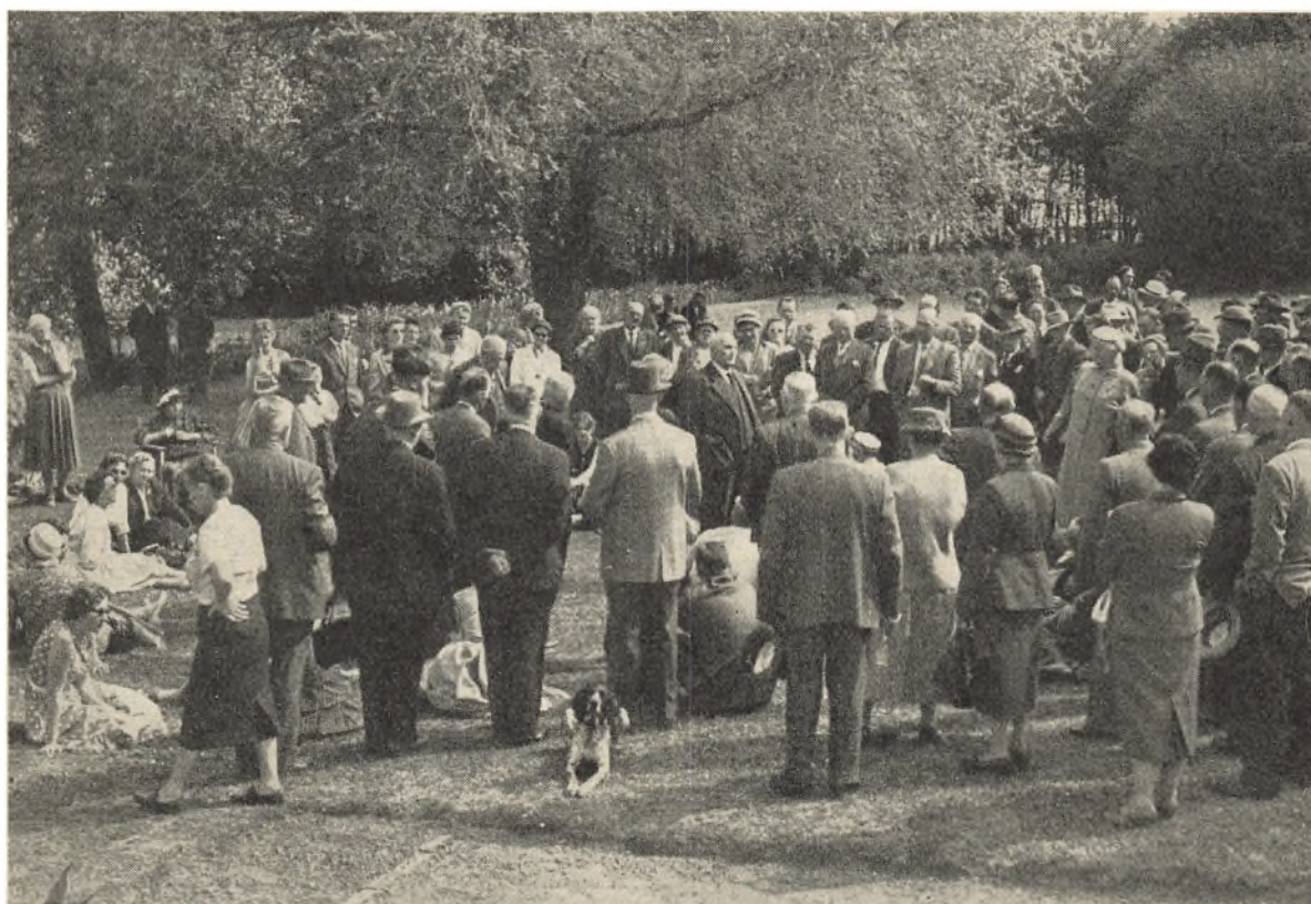
Man hygger sig i Gravendals have.

De første mødedeltagere indfandt sig midt på