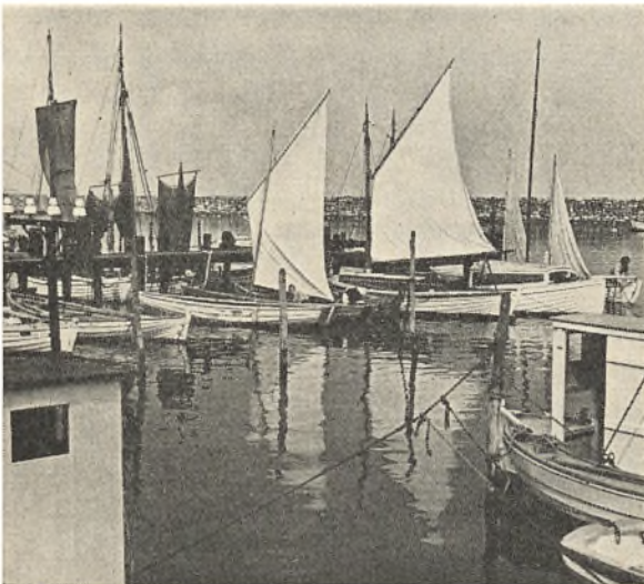
Fra Marstal havn.