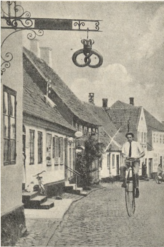
Gammeldags trafikmiddel i gade i Ærøskøbing.

højtaleranlæg for det store fremmøde og ønskede deltagerne god rejse på det sidste stykke af hjemvejen . . .«