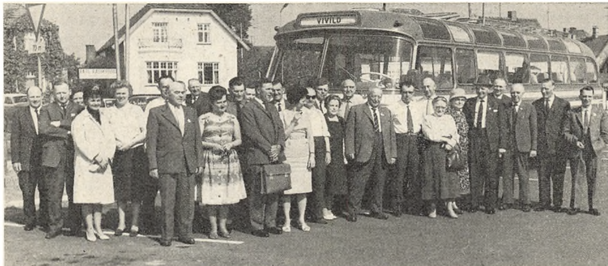
Medlemmer fra Randers amtskreds fotograferet i Nykøbing F.

Vi syntes, disse indgreb var urimelige, og vi syntes det så meget mere, som der for os at se manglede saglig baggrund for deres gennemførelse. Motiveringen var jo, at vi skulle have disse love gennemført af hensyn til Danmarks forventede indtræden i fællesmarkedet. Men situationen var jo netop den, at mulighederne for Danmarks ind-