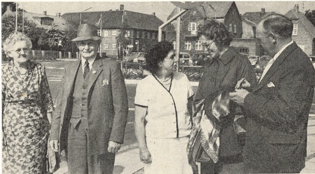
Gamle venskaber fornyes og nye stiftes ved årsmøderne.

Jeg vil gerne her rejse den tanke, at disse penge kommer landbruget til gode gennem udlån i forbindelse med gennemførelse af rationelt landbrugsbyggeri mod en rimelig rente og uden kurstab.