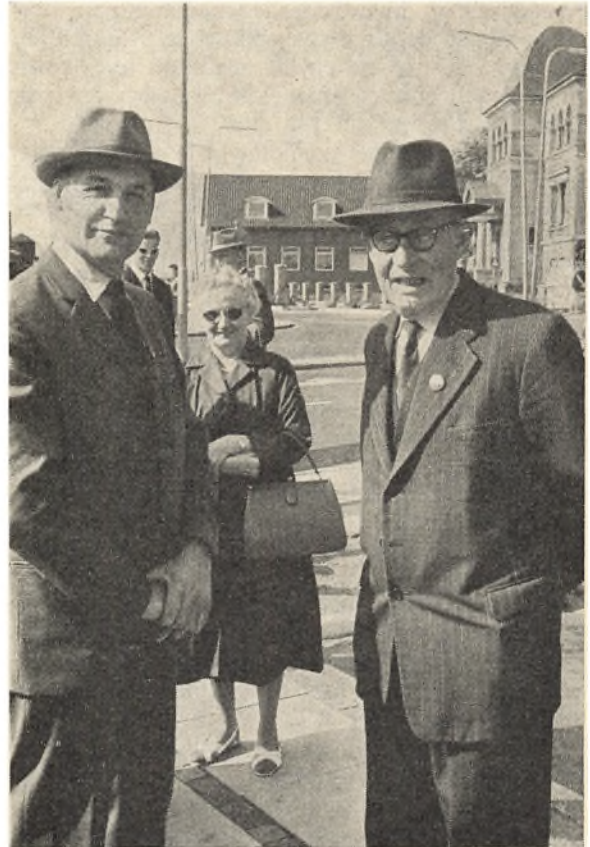
Mens der ventes på busserne.

Der er sket en ændring i dette. Afgangen er blevet endnu mindre end før, og det er os en stor glæde at se, hvorledes sønner og døtre træder i fædrenes sted i forhold til vor forening. Men det er tillige blevet sådan, at