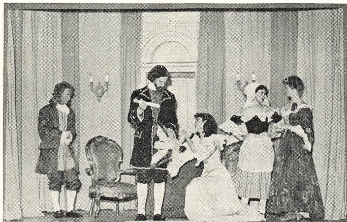
Fra opførelsen af »Tartuffe«.