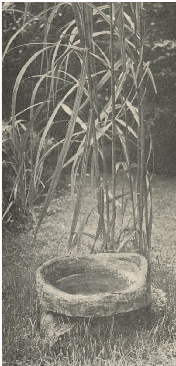
Bambus og fuglebad.