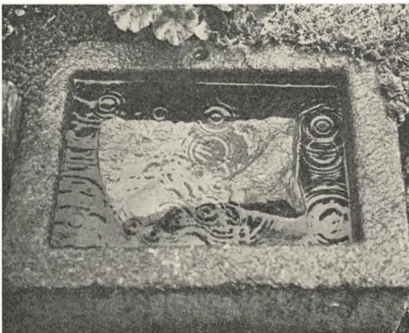
Dråberinge i et gammelt stentrug.

Han fik en ispind, og mågerne overlevede. Men