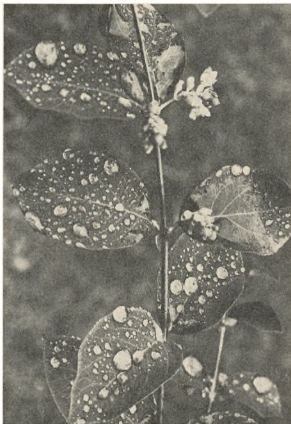
Dråberne spejler lyset.