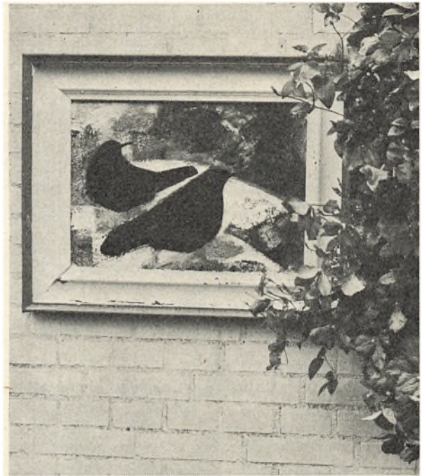
Solsortbillede i malerens have.

for fremtiden anmoder jeg det kære barn om at sætte skyderen fra sig i våbenhuset bag i bilen, før vi går fra borde og ind i havegalleriet.