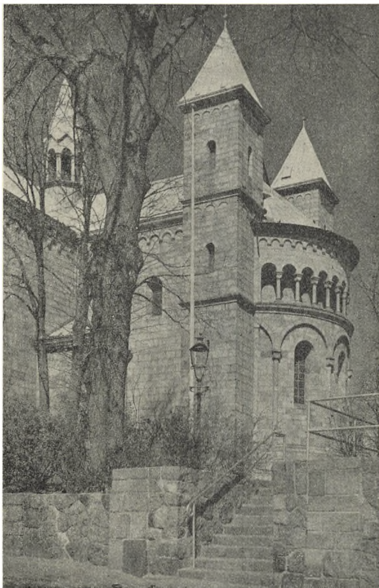
Viborg Domkirkes apsis.