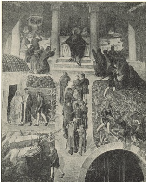
Detalje af Skovgaards udsmykning.

Der hørtes ikke flere knirk fra kirkestolene. Måske havde de forstået, at denne sidste havde været vidne til noget af det største, der kunne ske i den gamle kirke.