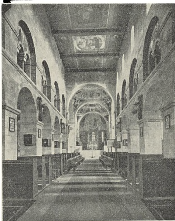
Viborg Domkirkes indre.

Viborg har en lang og spændende fortid. Alle-