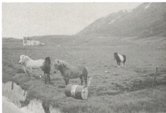
De verdensberømte islandske heste.

opvarmet med vand eller damp fra de varme kilder. Rørene er kun nødtørftigt samlede og kun dækket af jord, hvor det kan gøres uden for stort besvær. Utætheder gør ikke så meget, der er jo damp nok at tage af. — Denne geotermiske energi udnyttes også industrielt på mange måder, f.eks. i drivhuse, til drift af dampturbiner o.s.v. og oppe i Namafell krateret, hvor der for relativt kort tid siden har været udbrud, har man etableret et stort kraftværk og en fabrik til produktion af kiselgur. For at naturkræfterne ikke skal komme helt bag på de folk, der er beskæftiget der, har man boret et kæmpemæssigt termometer ned i krateret for at kontrollere eventuelle temperaturstigninger, som måske kan varsle et nyt udbrud. Nu er varmt vand jo ikke den eneste energikilde til rådighed på Island; den megen regn giver også baggrund for at udnytte vandkraftanlæg til el-produktion i stor stil, og el er billigt og vidt udbredt selv i ret tyndt befolkede områder. Således forsynes et stort aluminiumsværk ved Reykjavik med el fra eget kraftværk, ligesom også en kunstgødningsfabrik er storforbruger af el. — Og hvordan lever Islændingerne så. Der er kun ¼ mill. mennesker, og landet er 2½ gange Danmark. Det skulle give jordens tyndest befolkede land, kun 2 pr. km 2 . Halvdelen af Islands befolkning lever i området ved Reykjavik, og industri og fiskeri skaffer beskæftigelse til de fleste, og arbejdsløsheden er 0,9%. En mindre