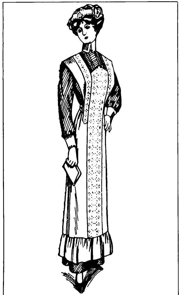
»Store og små hvite forklær brukes under alt renslig arbejde». Her et serveringsforklær fra Steen & Strøm til kr. 3,50.