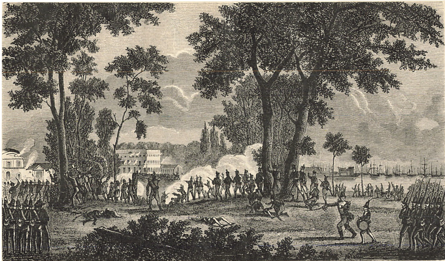
Udfaldet til Classens Have den 31. August 1807.