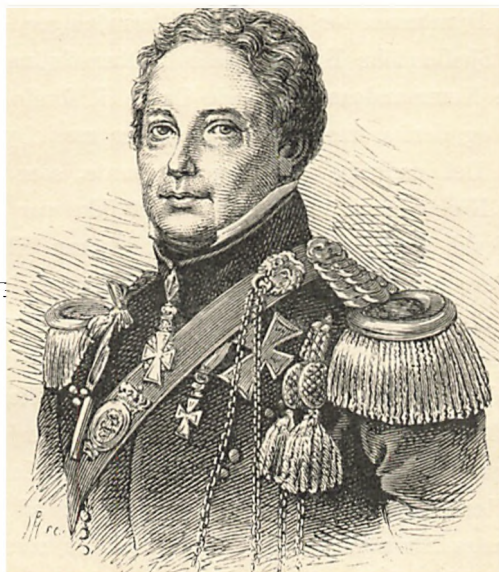
F. C. v. HOLSTEIN. I 1807 Chef for Kongens Livjægerkorps.