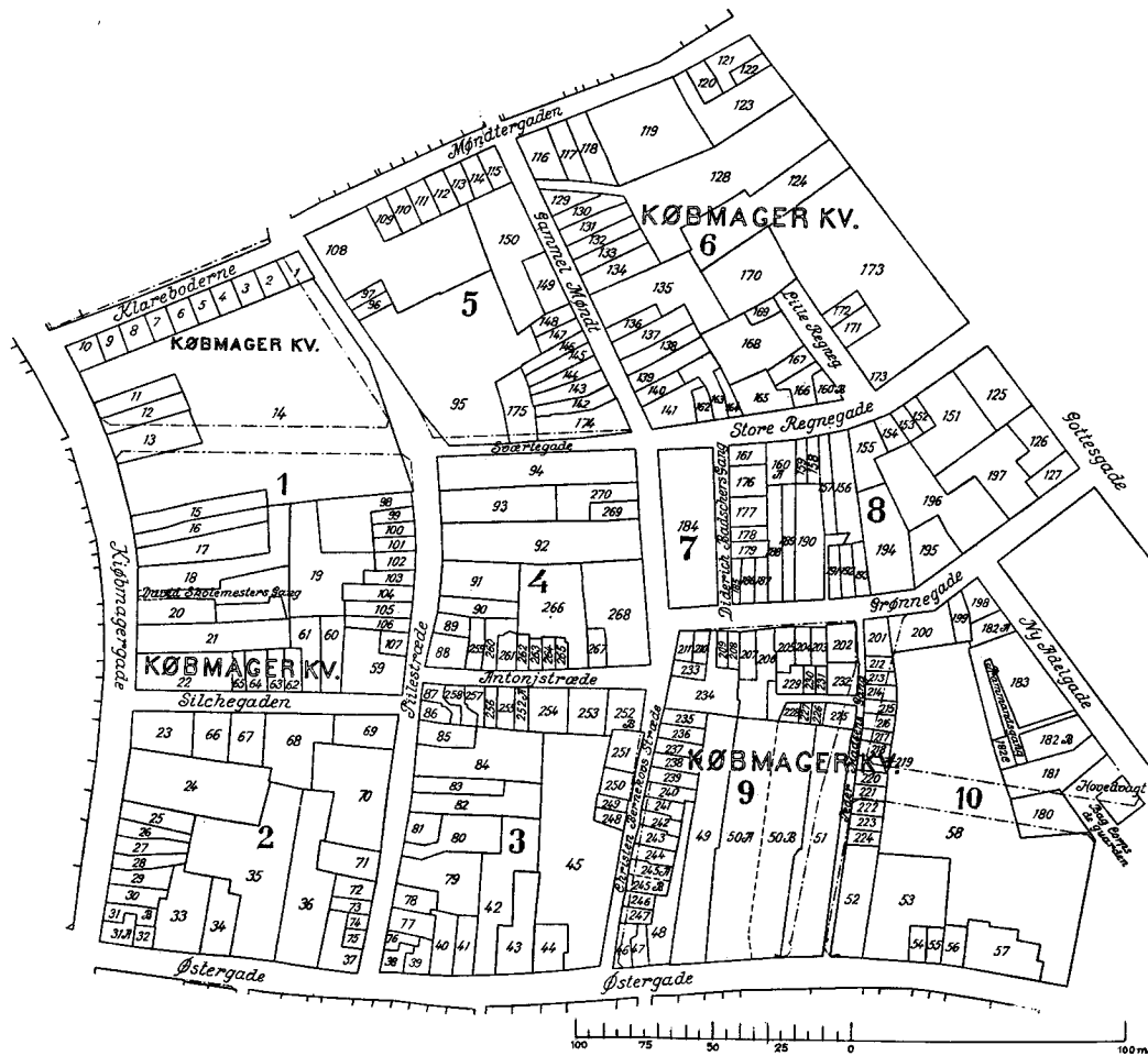
Kort over Købmager kvarter 1689 udarbejdet af H. U. Ramsing.