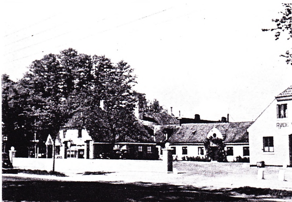
Røde Vejmølle Kro.