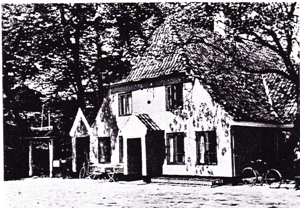
Rode Vejrmølle Kro.

udviser, at der ikke i en Række af Aar i bemeldte Kro har logeret nogen Rejsende, ligesom det og er mig bekendt, at bemeldte Kro kun har været afbenyttet af nærvejs boende Bønder, Kvægdrivere og Slagtere, af hvem Kroen, som beliggende ved Roskilde Landevej, ligesaa vel for Fremtiden som forhen vil blive søgt.