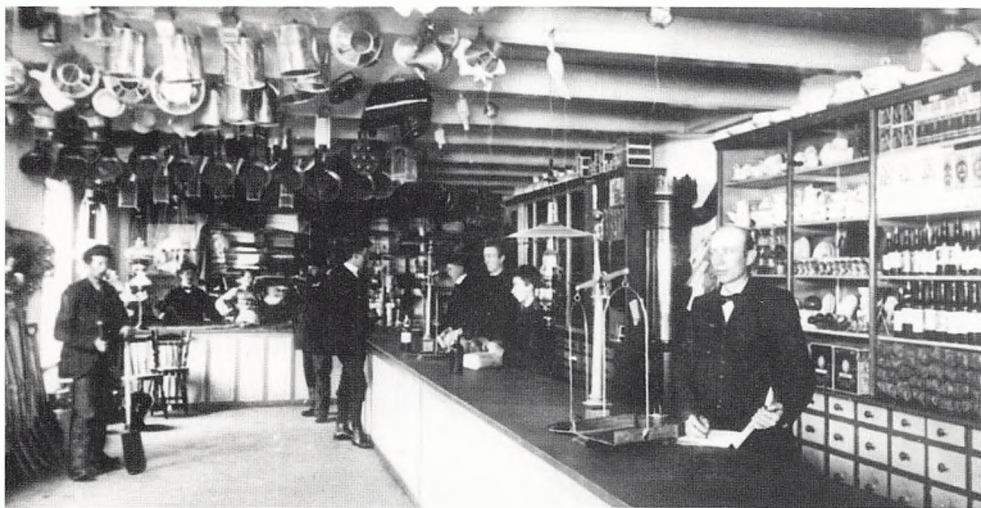
Jystrup Brugsforening ca. 1906. Brugsforeningerne havde et stort udvalg af varer, som det fremgår af billedet. Endnu tydeligere ses det i de lageroptællinger, man kan være så heldig at finde i retsbetjentarkiverne. (Midtsjællands lokalhistoriske Arkiv)

Der har været mange flere tilfælde, hvor sagen er afgjort ved voldgift, så det er kun en mindre del af de interne sager, der kan findes i retsbetjentarkiverne.