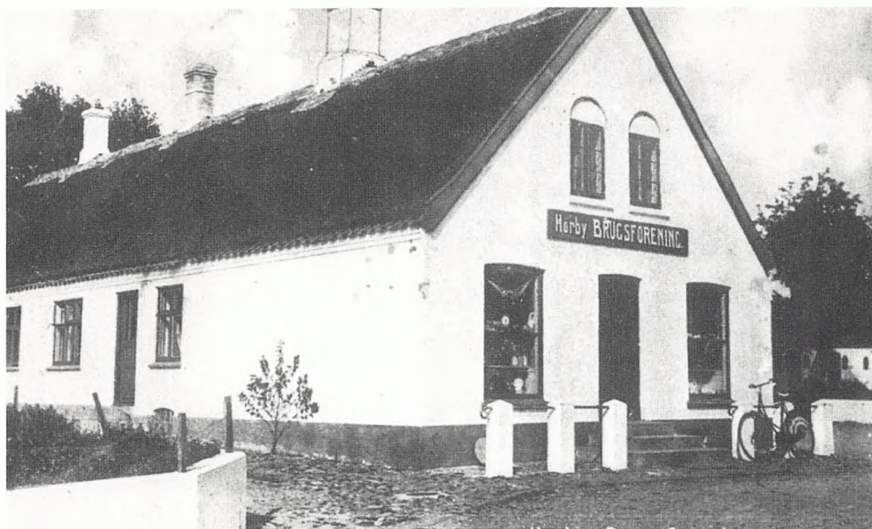
Hørby Brugsforening omkr. 1920. Mange brugsforeninger havde butik i den ene ende af uddelerens hus, og butikken flyttede, når foreningen skiftede uddeler. Senere købte eller opførte foreningerne selv butikken.

spørgsmålenes ordlyd. Modparten har ret til at stille kontrapørgsmål, og hvis disse spørgsmål ikke er forberedt på forhånd, kan såvel kontrapørgsmål som svar være indført i justitsprotokollen.