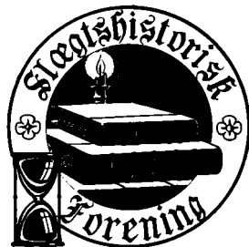
Slægtshistorisk Forenings bomærke