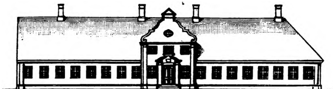
Århus latinskole i 1790'erne.