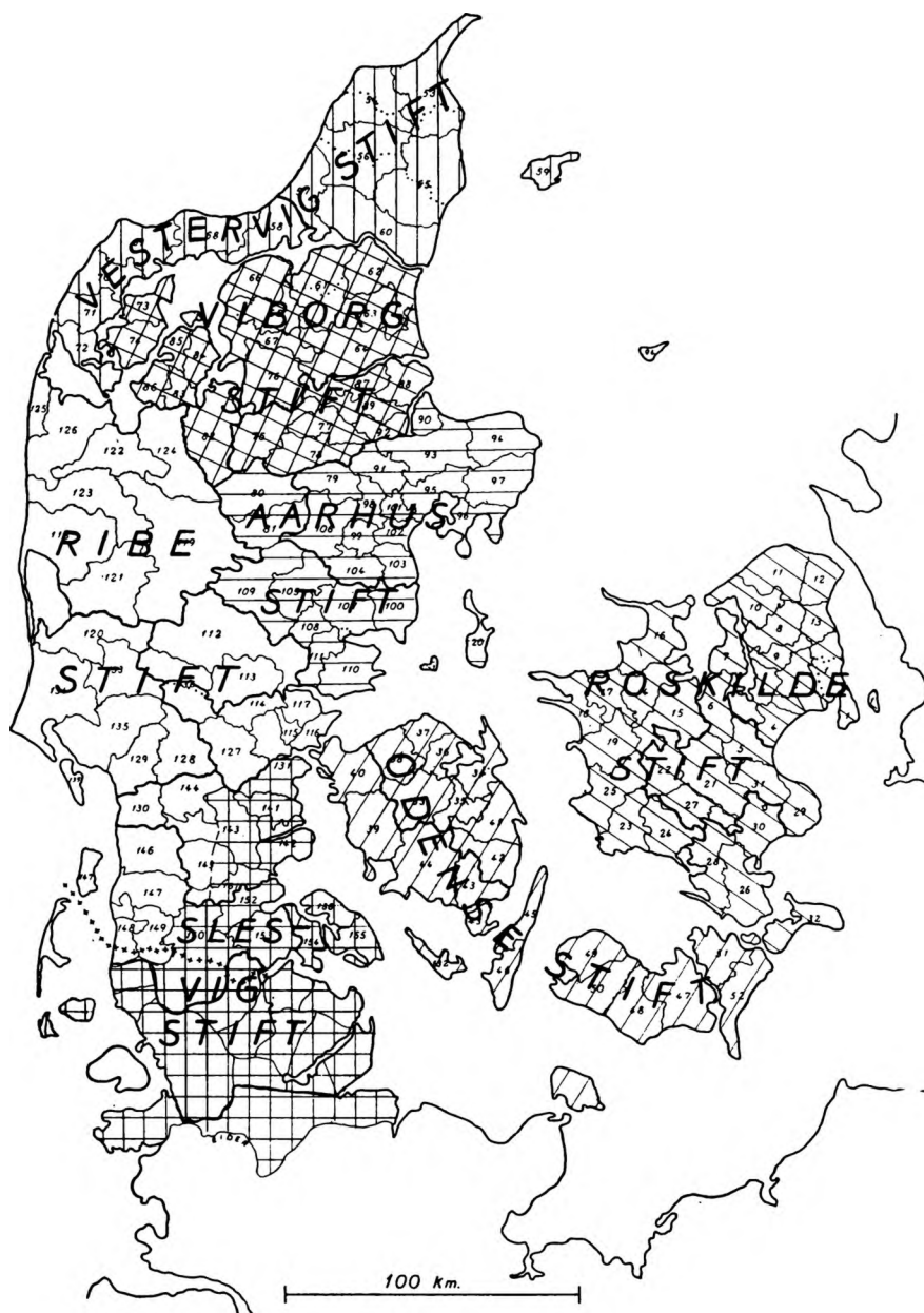
Kort 3 Stiftinddelingen i middelalderen.

Kort 3 viser stiftsdelingerne, der overalt kan ses at have stræbt efter at splitte oprindeligt sammenhængende dele. Bispesædet i Vestervig flyttedes senere til Børglum, efter reformationen til Aalborg. Maribo stift udskiltes 1803 af Roskilde stift, af hvilket København yderligere udskiltes efter genforeningen samtidigt med oprettelsen af et Haderslev stift omfattende de sønderjyske landsdele.