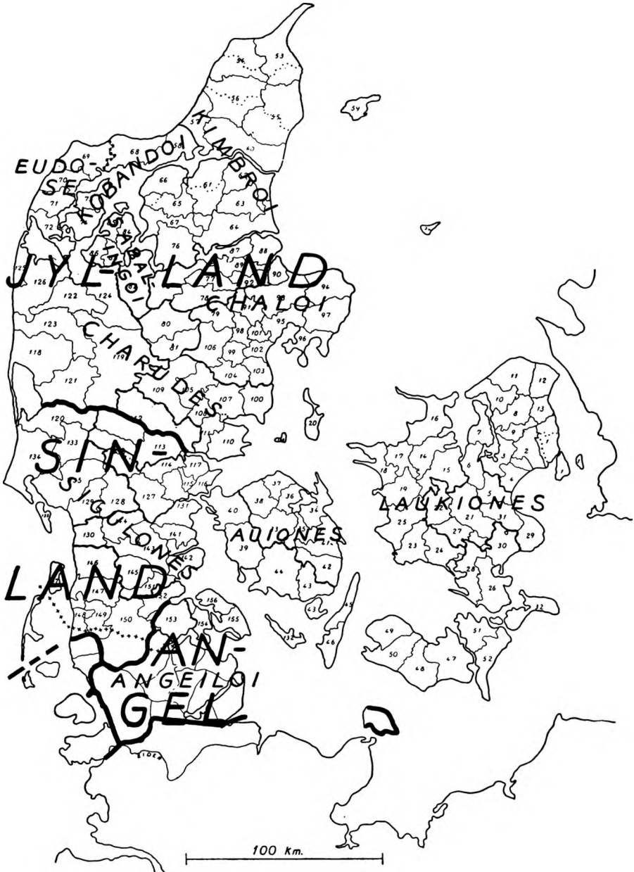
Kort 4 Stammeomraader og »lande«

Kort 4 viser endelig de stamme og landegrænser, som man kan slutte sig til. De 6 nordjyske lande kan regnes forbundet om Viborg landsting c. 7 e. Kr., Angel og Sinland om Urne landsting c. 455 e. K. Nord-Frisland erobredes 741, landet mellem Sli og Eider c. 800 og afstodes ved traktat af 811, fornyet c 1027. Sammensmeltningen af Jylland og Sinland er søgt fremmet ved oprettelsen af Jelling syssel c 1060, samtidigt med, at landet mellem Sli og Eider lagdes ind under Urne landsting og landet mellem Kongeaagrænsen og Skjerna-Vejlefjordlinien til Viborg landsting.