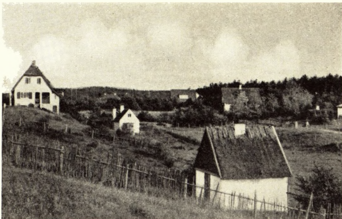
Solbakken i Tisvildeleje 1918.