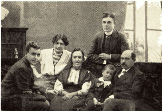
Fader fotograferet med sin familie i 1908. Fra venstre Erik, Inger, Eleonore, Svend, Frits og fader

bejde; måske har han talt mere derom med sine to yngste sønner, der begge blev polyteknikere.