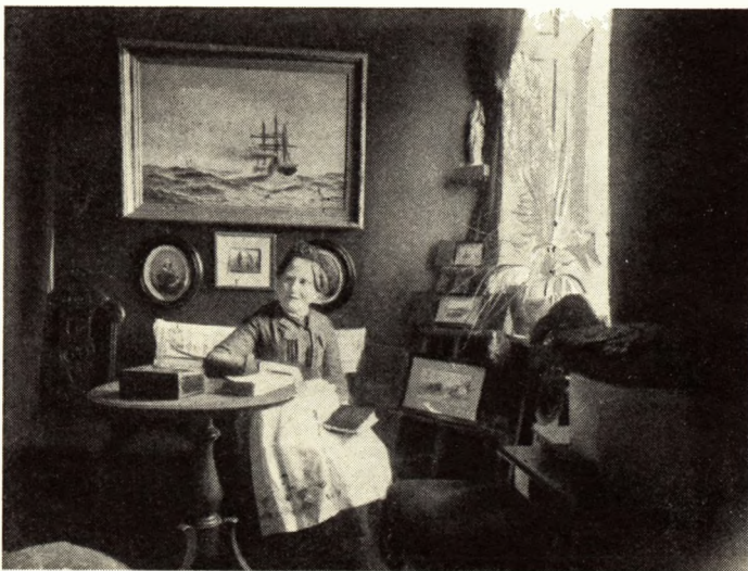
Farmoder i dagligstuen i Allégade ca. 1888.

26. juni 76: Det er voldsomt, saa Kulturen stiger i det nord-vestlige Sjælland, navnlig i dramatisk Henseende. Efter det sidste heldige Forsøg i Julen tror jeg virkelig, at vi ikke vil faa saa lidt Fornøjelse af den nye Komædie, I har tænkt at sætte i Scene. Jeg kender forresten ikke „Familiætvist“ (Komædie af Hostrup), men jeg tvivler naturligvis ikke om, at Stykket er valgt med megen Smag. Anbefalet er mig Frk. . . ., der ønsker at indvi sig til Thalias Præstinde.