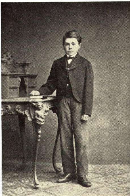
Fader, som han så ud, da han kom til København for at gå i Metropolitanskolen. (Chr. Neuhaus fot. ca. 1870).

derimod klagede han over sine ringe kundskaber i engelsk og til dels fransk. I dansk skrev man i de tider stile med emner væsentligt hentet fra den klassiske oldtid. I en af faders stilebøger findes derudover en stil med titlen: Min glæde over, at jeg er Kristen og født i et kristent Land . Han fik 5÷; ungdommen idag ville sikkert være noget desorienteret ved at skulle skrive en sådan stil.