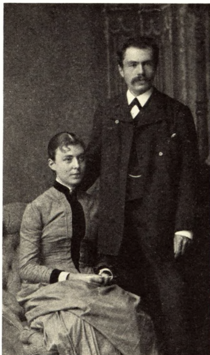
Fader og moder fotograferet 30. juni 1885 i Horsens.

1901. Det var hendes opgave at hjælpe med børnenes opdragelse og sammen med Nille at passe huset.