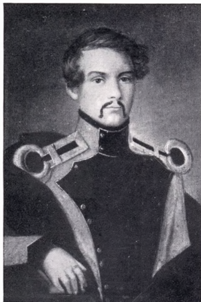
O. C. F. SAABYE I LØJTNANTSUNIFORM 1834