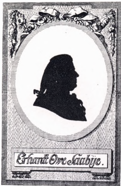
FORPAGTER PAA SØHOLM født 1747