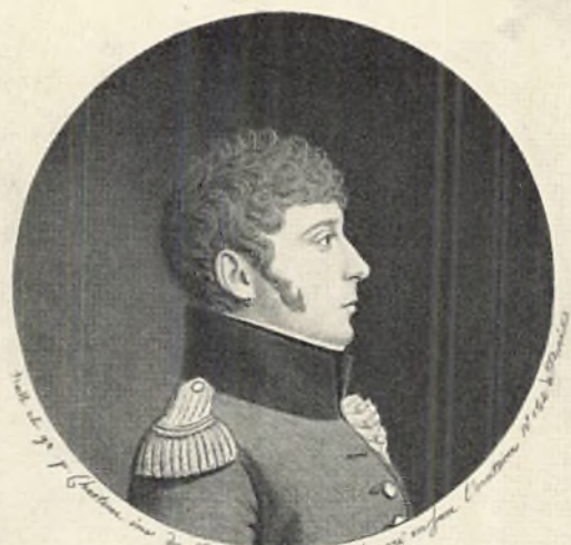
1812. 7. 1. Geboren am 20. September 1788 in Wien. Einmalig in Wien 1812. 1812.