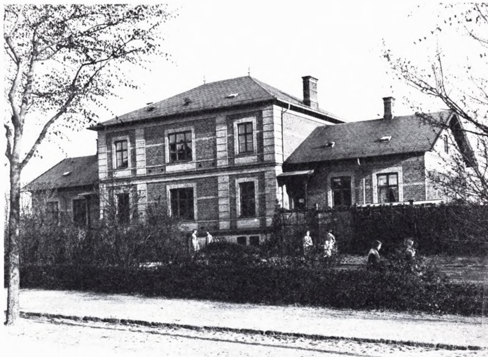
Den sydøstlige børnehjemsbygning, opført af arkitekt Hagemann 1882 til 13.-14. afdeling (nu kaldt „Svinget“). (Fot. Johs. Hansen, Frederikssund, ca. 1895).

sammenhængende bygning, i hvis midte der på 1. sal indrettedes en tjenestebolig til forstanderen, der hidtil havde boet på selve slottet. I stueetagen under denne bolig indrettedes kontor og lagerrum. I bygningens endefløje installeredes 4 nye børnehjem, således at stiftelsen kunne modtage yderligere 80 piger. Indretningen af de nye afdelinger fulgte det engang fastlagte skema. Bygningen var helt færdig til ibrugtagen i foråret 1876.