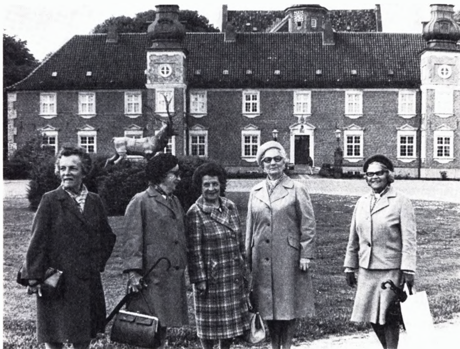
Fem „gamle piger“, elever fra 6. afdeling indtil 1925, har sat hinanden stævne foran slottet på den årlige sommerudflugt. Fotograferet til Frederiksborg Amts Avis, 3. juni 1973.

bruden til kirke i grevindens karet. Det tilhører nu historien. Så sent som i juli 1973 arrangeredes der bryllup i »Svinget«. De plejemødre, som efter deres afgang bor i huse, der tilhører stiftelsen, får desuden ofte besøg af deres gamle plejebørn, og i januar 1973 enedes en kreds af sådanne gamle plejebørn om at hylde deres gamle plejemoder i anledning af hendes runde fødselsdag. Også udenfor stiftelsen holder de gamle elever sammen. Igennem en lang årrække er der skabt tradition for, at en tidligere lærerinde ved Jægerspris samler gamle elever til månedlige møder i København. Deltagerantallet er i reglen 25–30 personer.