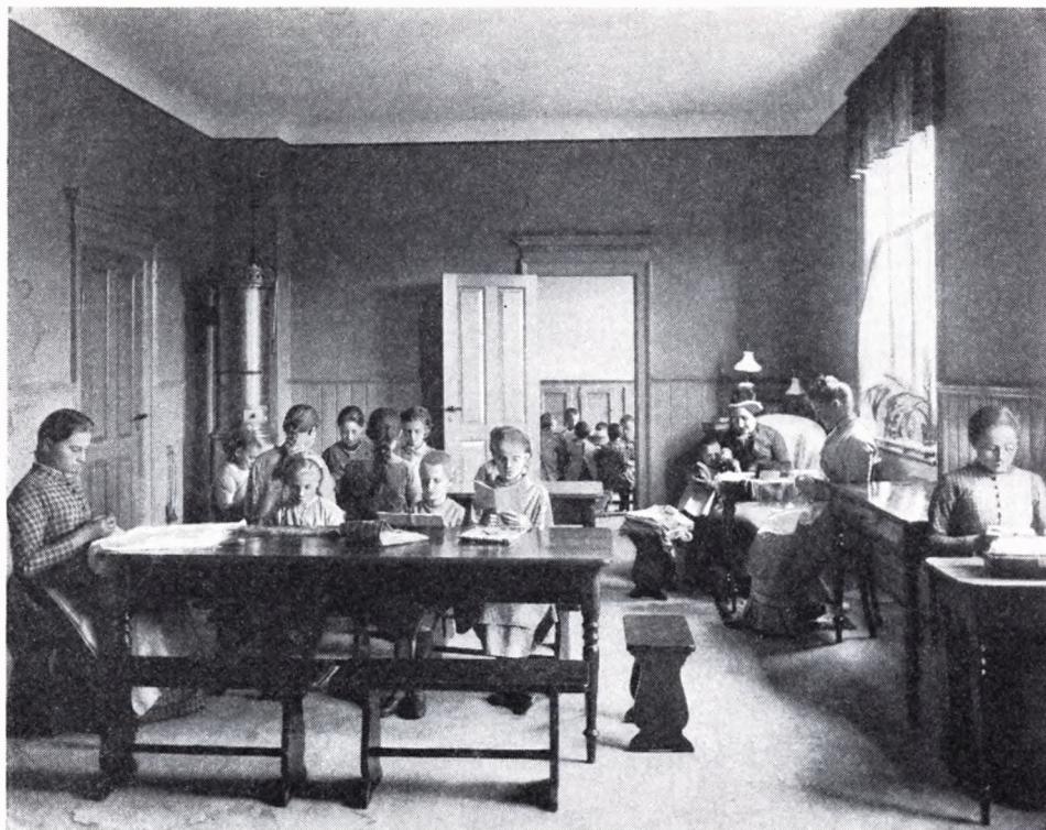
Dagligstue og læseværelse i et af børnehjemmene. gengivet i stiftelsens 25-års beretning 1899.