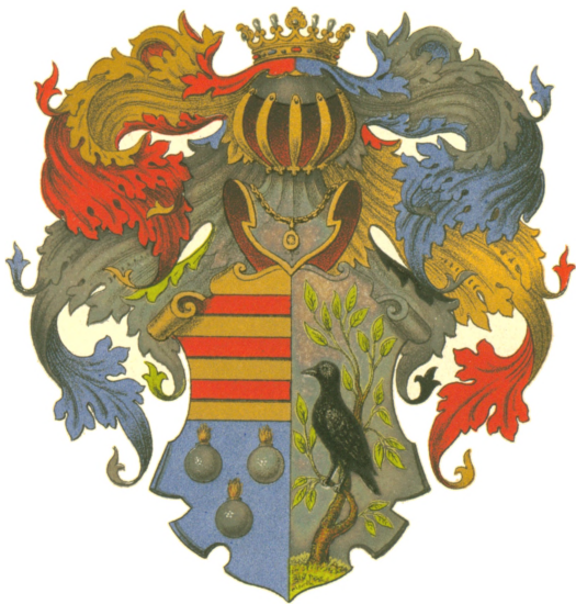
Le Sage de Fontenay.