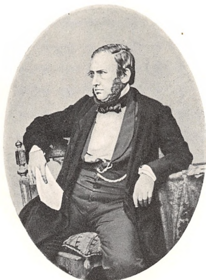
A. F. KRIEGER Fotografi fra 1870'erne