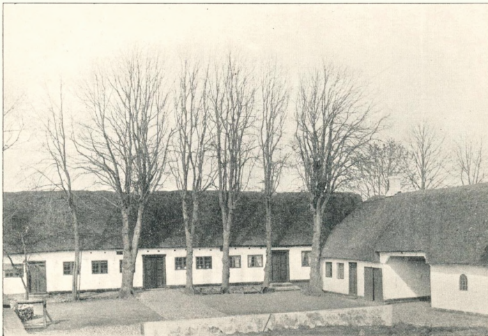
Stamgaarden i Malling 1880.