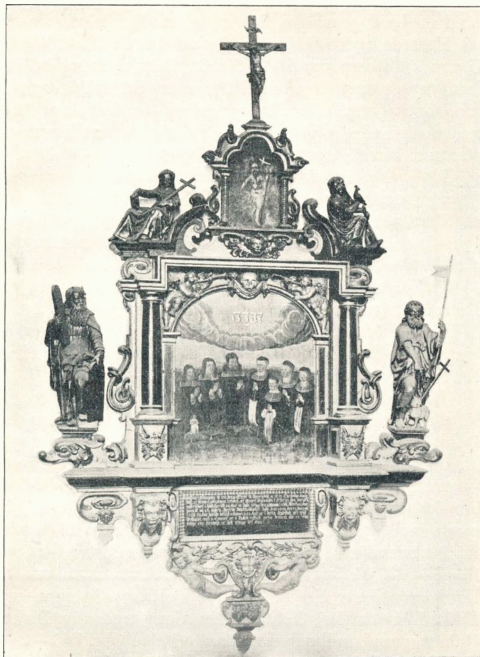
Epitafium i Odder Kirke.