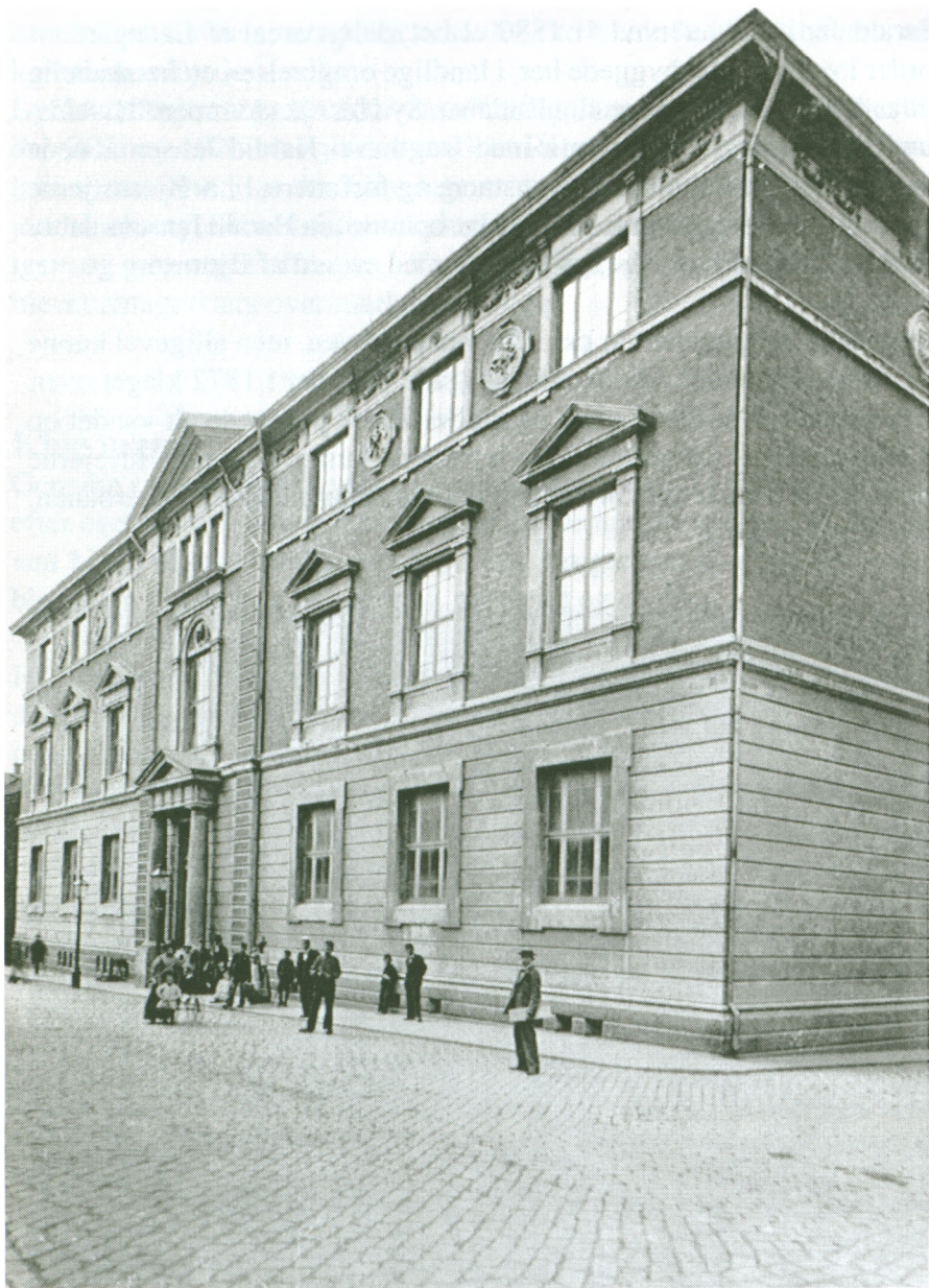
Aalborg Historiske Museum efter ombygningen 1893-95