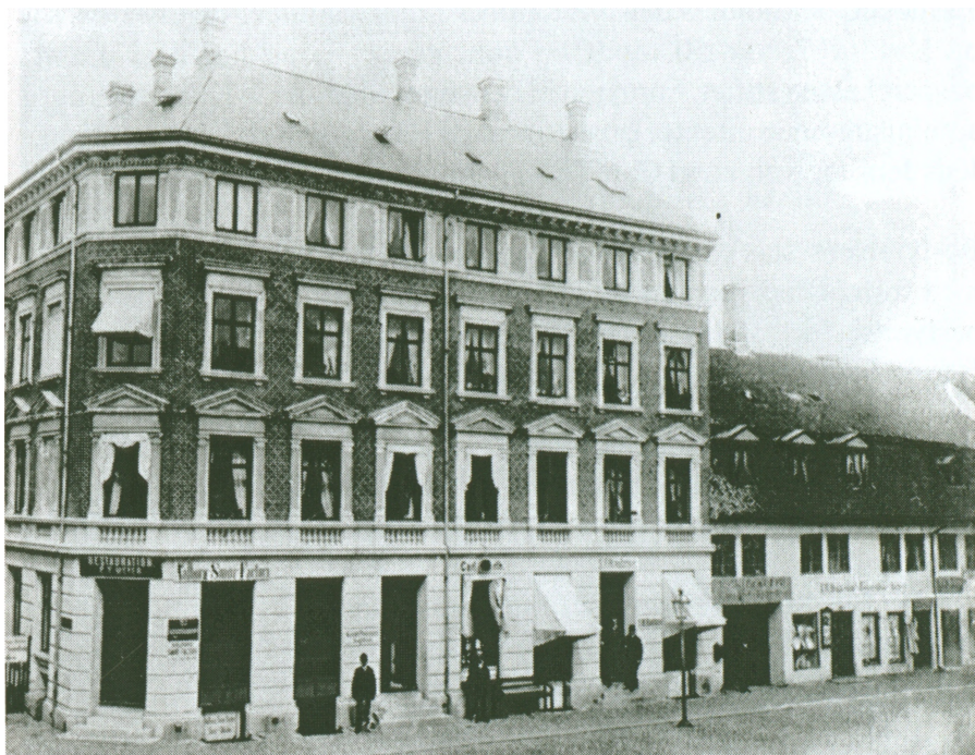
Landbosparekassens “fødested” . Hjørnet af Bernhard Rees Gade og Nytorv