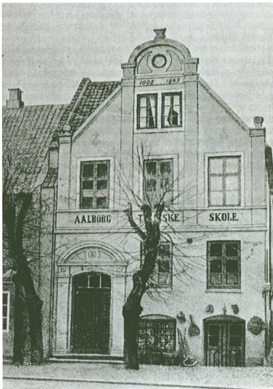
Aalborg Tekniske Skole i Østeraagade - i brug i 1872