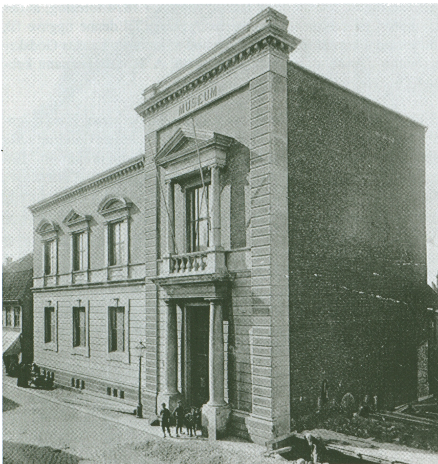
Aalborg Historiske Museum, der startede som kunstmuseum. 2 måneder senere var historisk museum med.