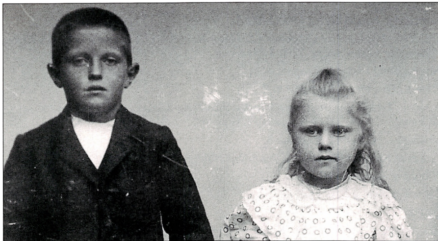
FOTO: ER DER NOGEN DER KAN IDENTIFICERE DETTE FOTO (ELLER DISSE TO BØRN)? ENHVER OPLYSNING OM DEM ELLER PERSONERNE PÅ FOTOET PÅ FORSIDEN ELLER PÅ SIDE 4 MODTAGES MED TAKNEMMELIGHED.

Arbejdsområde: Lolland, Falster, Møn og hele Roskilde a og Sorø a.