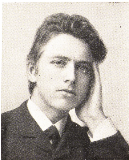
JEPPE AAKJÆR som ung.