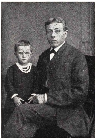
Brøndsted med en af sine første Elever.

Under sit første Ophold i Brejning havde han maattet love Vennerne der at komme igen og fortsætte Lærergerningen, naar han havde faaet sin Eksamen, og det Løfte holdt han naturligvis.