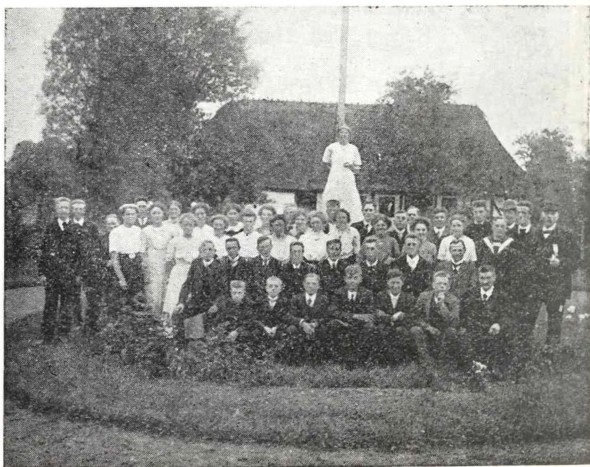
Hjemly Efterskoles Elevmøde 1913.

Og naar han fortalte Danmarks- eller Verdenshistorie, lyttede vi med stor Opmærksomhed. Ordene flød ikke let for B. Men hver Sætning var vel overvejet og stod som malet for os. Navnlig kunde han komme i Aande, naar Talen var om Mænd eller Kvinder, som havde maattet kæmpe sig frem gennem trange Kaar, men som