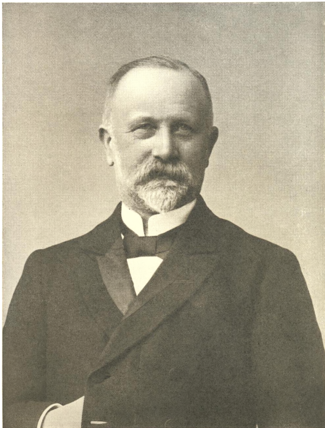
LEMMING EMIL VALENTINUS VETT GEHEIME ETATSRAAD