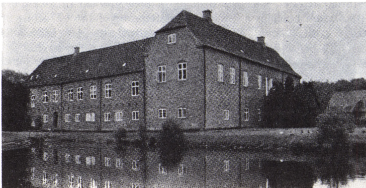
Herregården Bolfer ved Horsens