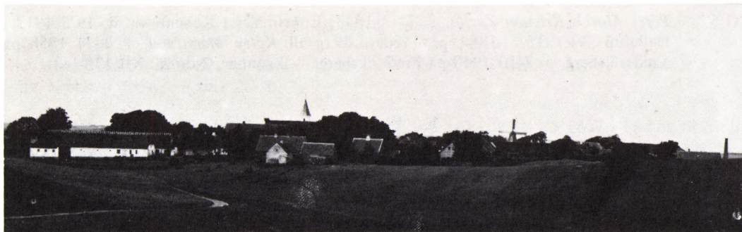
Them med »Skovridergården« i forgrunden