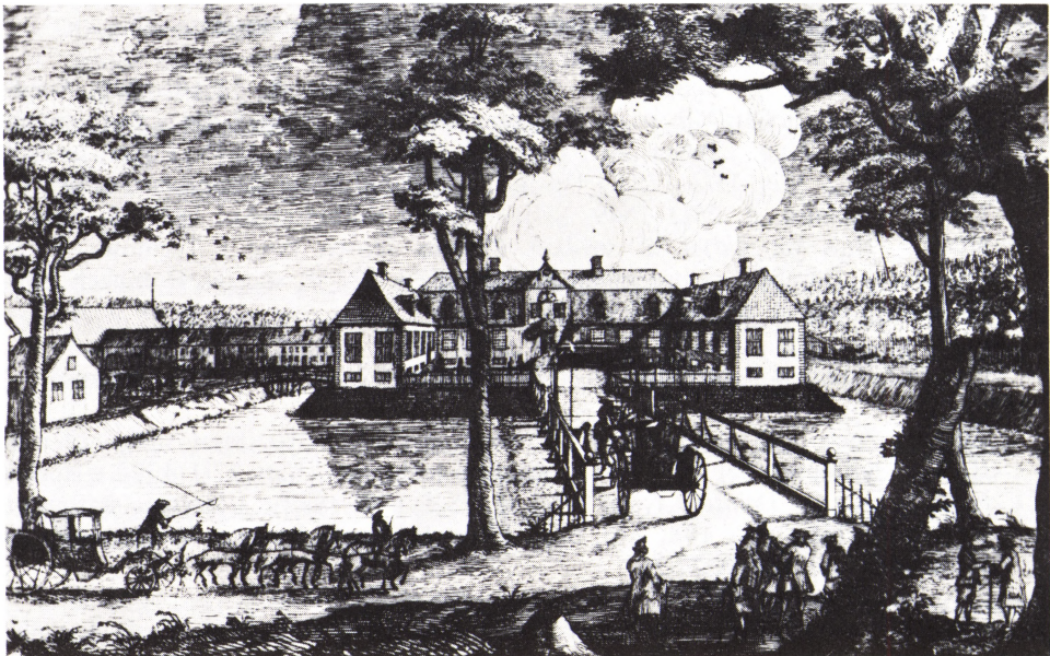
Frijsenborg ca. 1800

De bornerigeste familier er: X 7 Andreas Zacho med 3 hustruer i Bøsbro: 13 børn, og X 14 Jorgen Zacho med 5 hustruer i Sejet: 14 børn. Tre ægteskaber var barnløse.