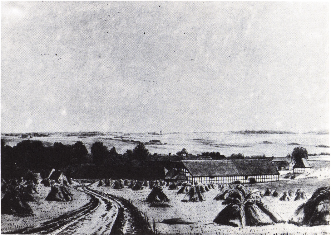
Pederstrup ca. 1880