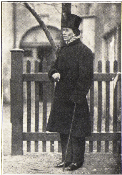
H. C. ANDERSEN SOM ÆLDRE I AMALIEGADE

lige«, verdensberømte Digter, den betitlede Elsker af Ordner og Rang. Med deres ubekymrede