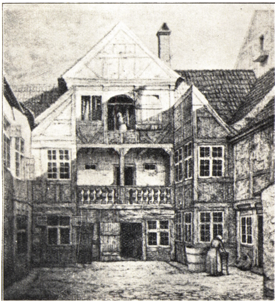
DEN COLLINSKE GAARD I AMALIEGADE

og bitter Klage, hvor ondt han dybest set har det hos dem han elsker højest. Eks. i Brev til