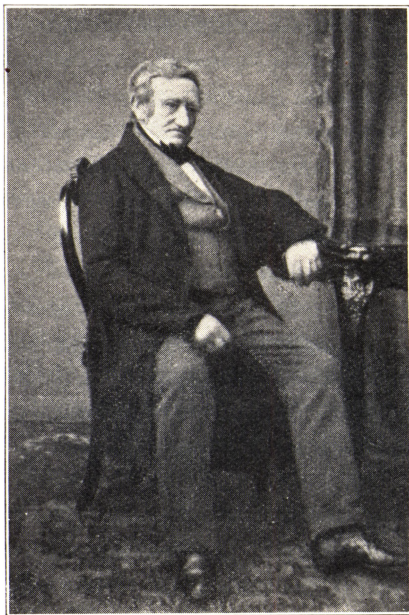
GEHEIMEKONFERENSRAAD JONAS COLLIN (1776—1861)

og Udskud og dog var forblevet ren og uskyl- dig og gennemsigtig som en Dugdraabe, og af den