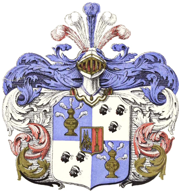
Familien „de Thurah's" Vaaben