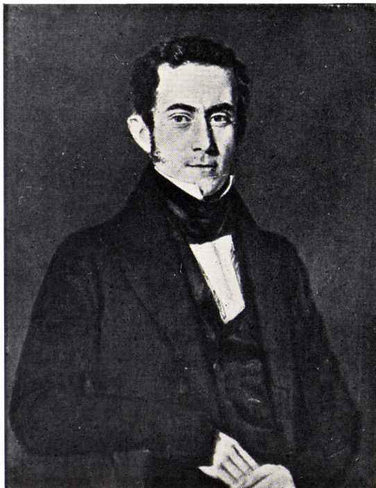
ETATSRAAD A. N. HANSEN 1798—1873