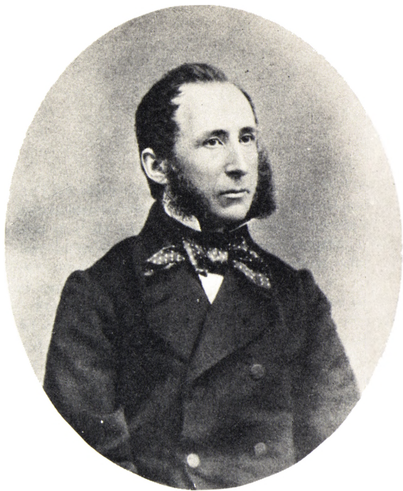
ETATSRÅD REGNAR WESTENHOLZ 1815-66