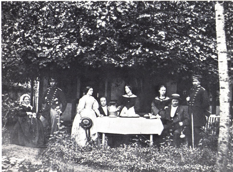
På højen i Sct. Annagade i Bogense 1864.