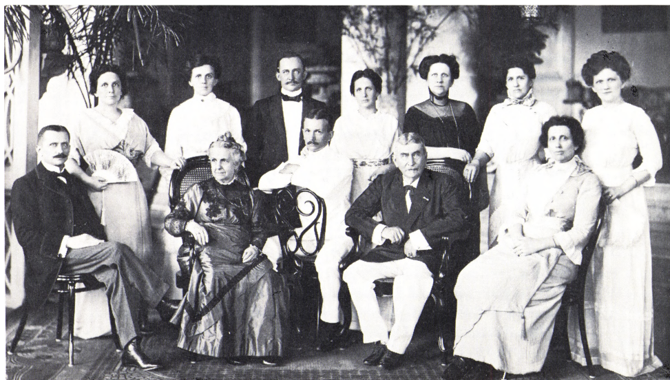
Guldbryllup i Probolingó på Java 1914-01-20. Forældre med 10 søskende.