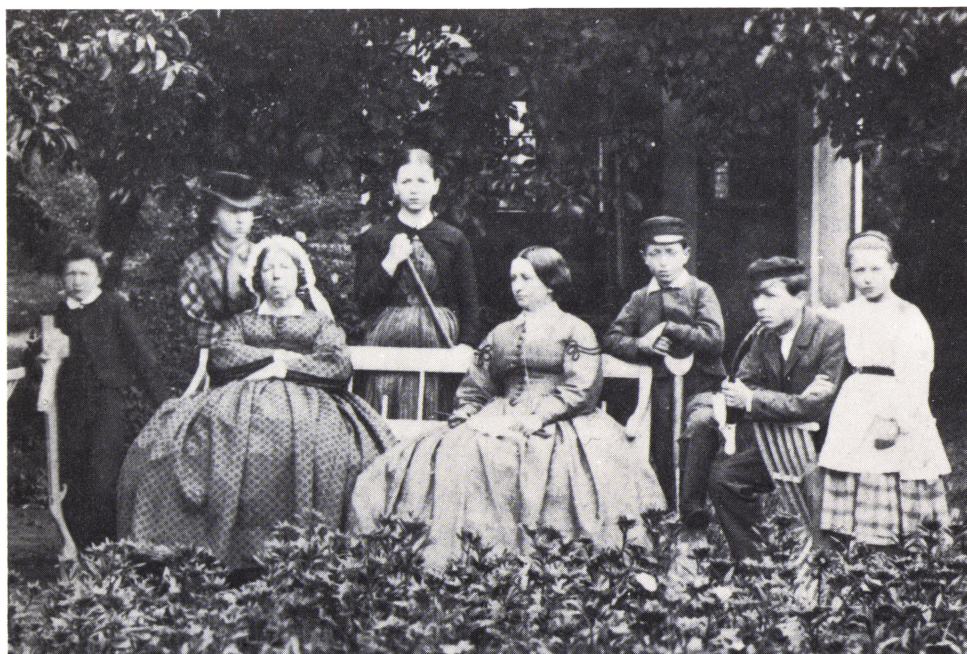
Kalundborg. Apotekets have ca. 1867.