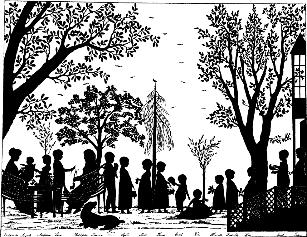
Den store Brolokke-silhouet.