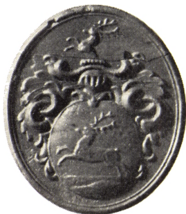
9. Segl efter signet, der antagelig har tilhørt sognepræst til Askim, Povel Hiort (1709–1778).