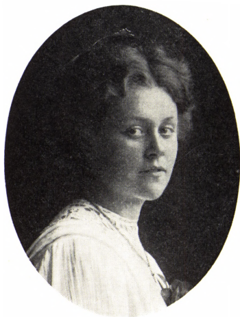
33. Astrid Hiort f. Ring 1884–1966