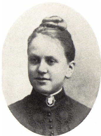
27. Elisabeth Hiort uigt 1872–1950