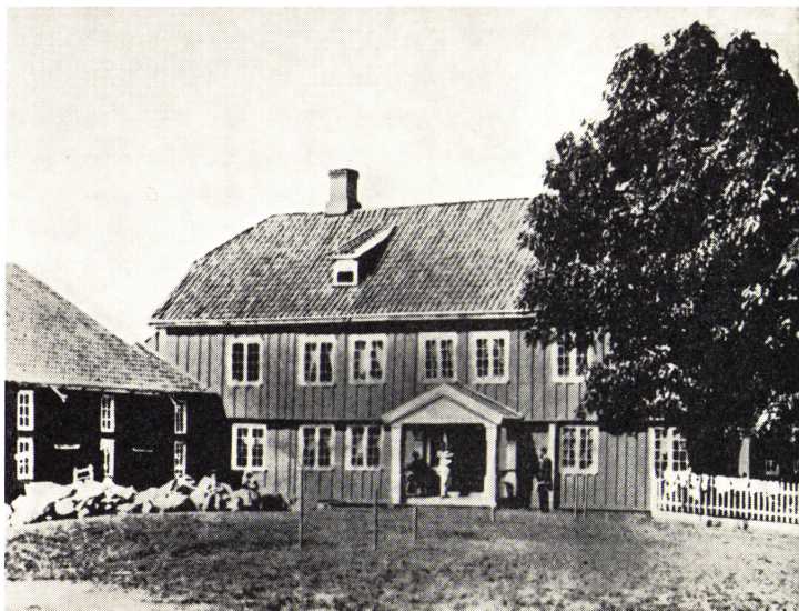
8. Askim gamle præstegård, opført ca. 1695, nedrevet 1866.