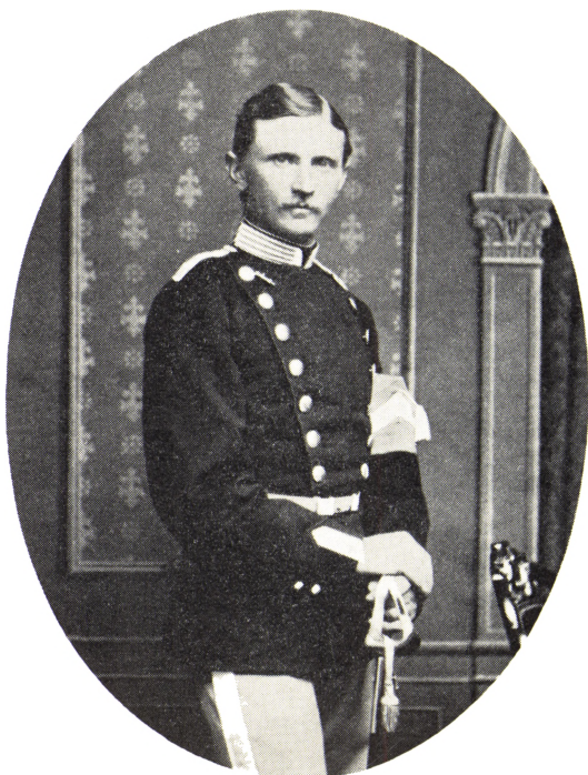
23. Ewald Bierregaard Hiort Oberstløjtnant 1838–1903