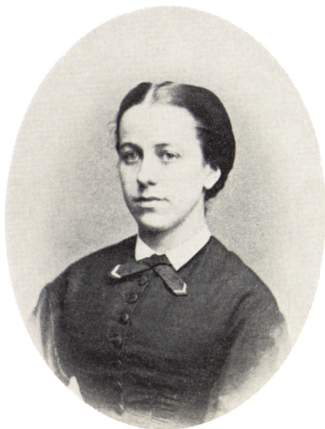
19. Elisabeth (Betzy) Hiort f. Hindenburg 1839–1899