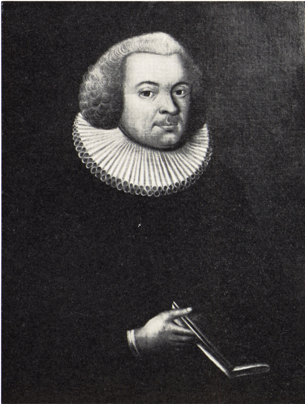
2. Peder Hiort Sognepræst til Ullensaker 1700–1765