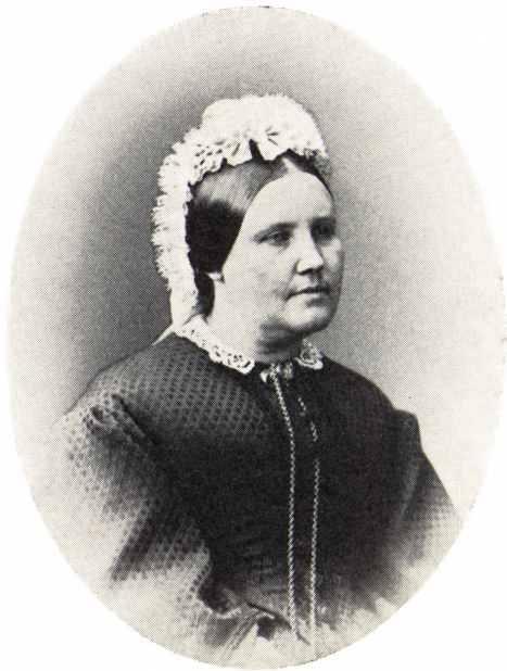
15. Karine Hiort gift Brock 1821–1905