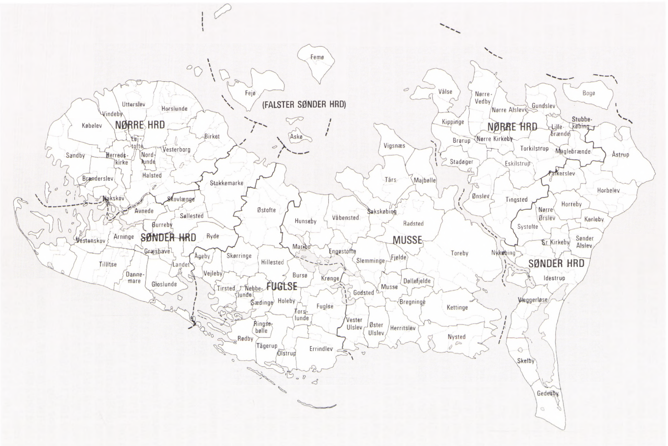
Den geistlige inddeling 1770