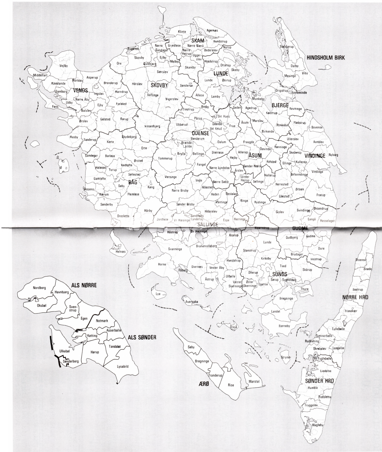
Den gejstlige inddeling 1770 (Kegnæs sogn på Sydals hørte til Slesvig stift).