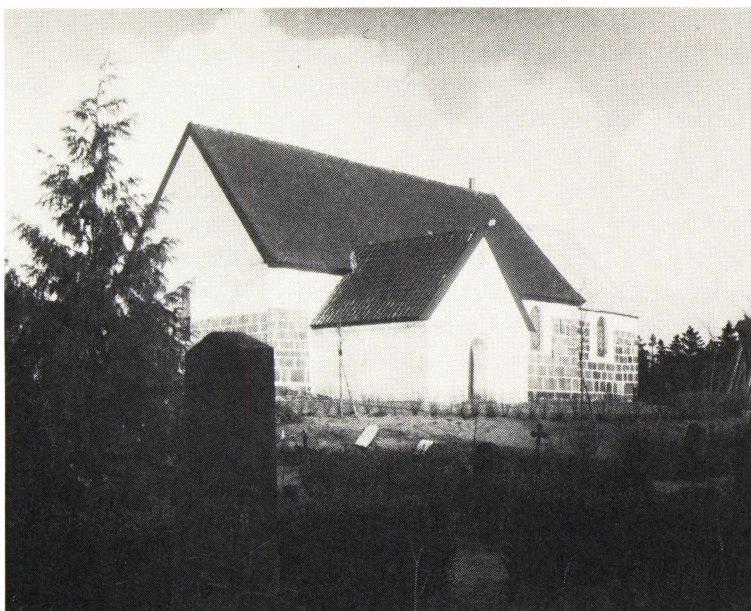
Grindsted kirke på Sommers tid. Kirkens nuværende udseende er resultatet af en stor ombygning 1921-23 under ledelse af arkitekt H. Lønborg Jensen. Foto ca. 1890. (Grindsted lokalhist.arkiv).

die; så lavede jeg mig et lille værksted i et af de to såkaldte gæsteværelser, og det andet skulle være min mors lejlighed. Min jomfru fik værelset ved køkkenet og det stenlagte bryggers, hvor også den lerklinede bageovn fandtes. Her var ikke tale om andet end at gøre alt arbejde selv, brygge og bage rugbrød, og alt hvad andet der kunne forefalde.