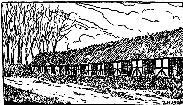
Kirkestaldene ved Egen Kirke.