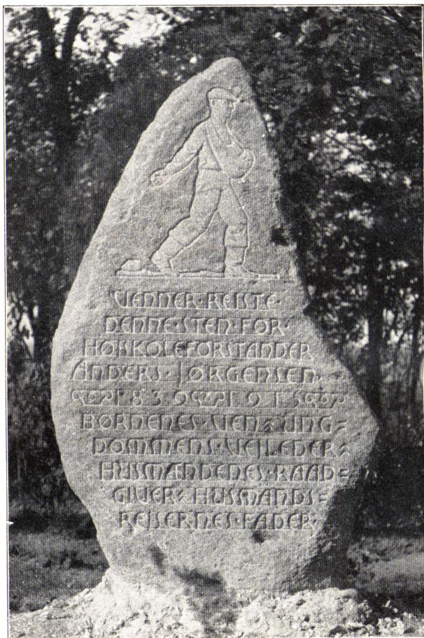
Mindestenen i skolens have.