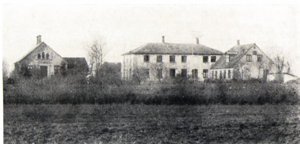
Høng højskole o. 1885 (set fra øst).

Fra venstre Harrekildes hus (med udhus). Sydenden af gymnastiksalen. Hovedbygningen. Tilbygningen 1874.