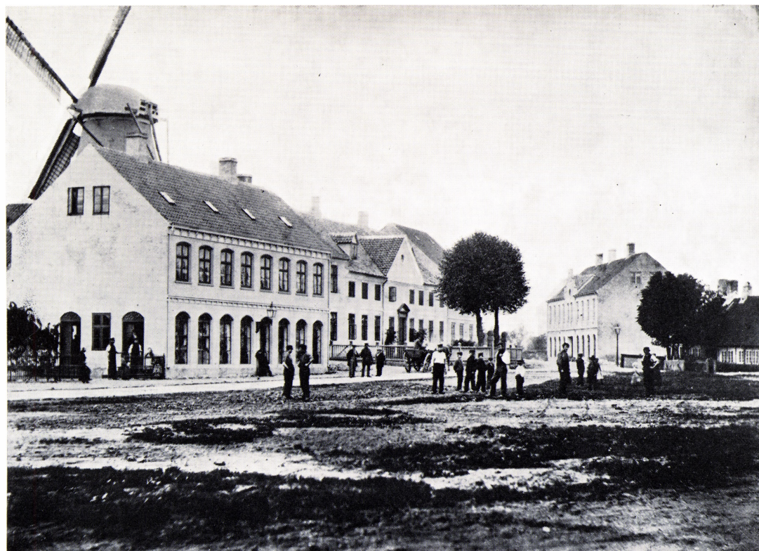
Den gamle markedsplads under omlægning til »Lagonis Minde« 1876.

med et betræk i alle regnbuens farver, disse bolde var langt de bedste til langbold eller spytte, som vi kaldte det, meget at foretrække for den dengang lige fremkomne gummibold, der senere blev så stor en artikel i forretninger.