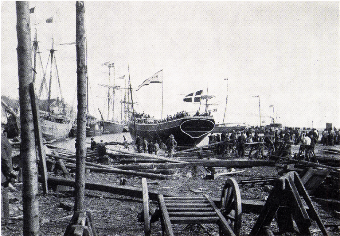
Rasmus Møllers værft.

Møllers værft var i sin tid et berømt foretagende, der af alle blev beundret som en god og lærerig arbejdsplads.