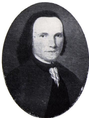
Agent Jørgen Ploug (1737–1800).

Faaborg byhistoriske Arkivs publikationer nr. 3, 1944 genoptrykt 1974