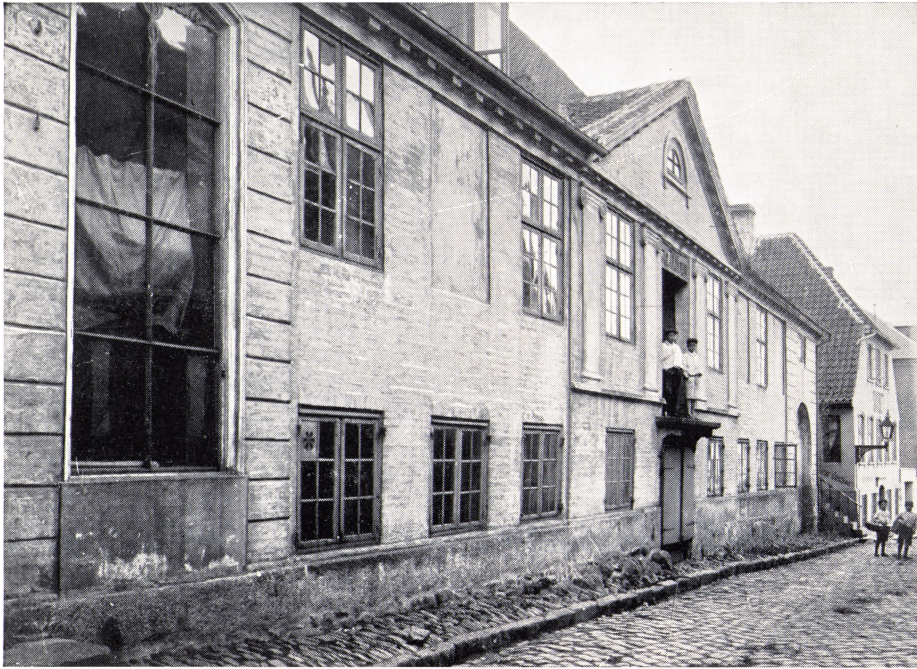
Magazingaarden i Strandgade.

I 1824 forliste briggen i Kattegat. En velvillig sjæl skrev et sørgedigt til trøst for den sørgende reder.