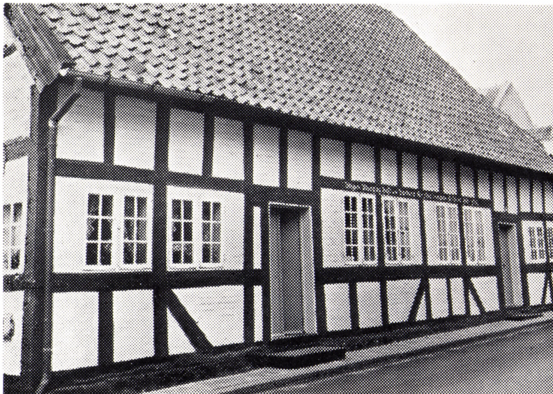
Den Ploug-Hempelske Stiftelse. Grønnegade nr. 48. Oprettet 1801.