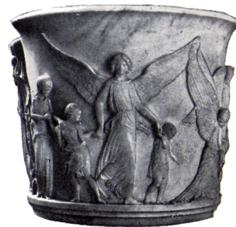
Døbefonten i Faaborg Kirke.

Ligesom faderen havde han pulpitur i kirken og har sikkert også interesseret sig for denne, hvilket fremgår af, at han før sin død hos billedhuggeren Freund, med hvem han stod i personligt bekendtskab, havde bestilt den marmordøbefont, der nu findes i kirken, men som først blev leveret 7 år efter hans død.