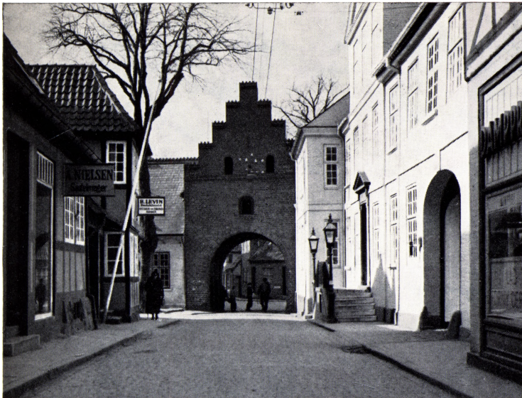
Handelshuset Ploug's hovedsæde. Den hvide bygning tilhøjre.

lange og sympatiske omtale af hans person og referat af begravelsen.