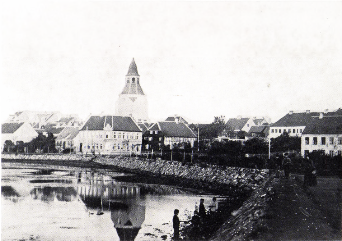
Før banens anlæggelse 1882.