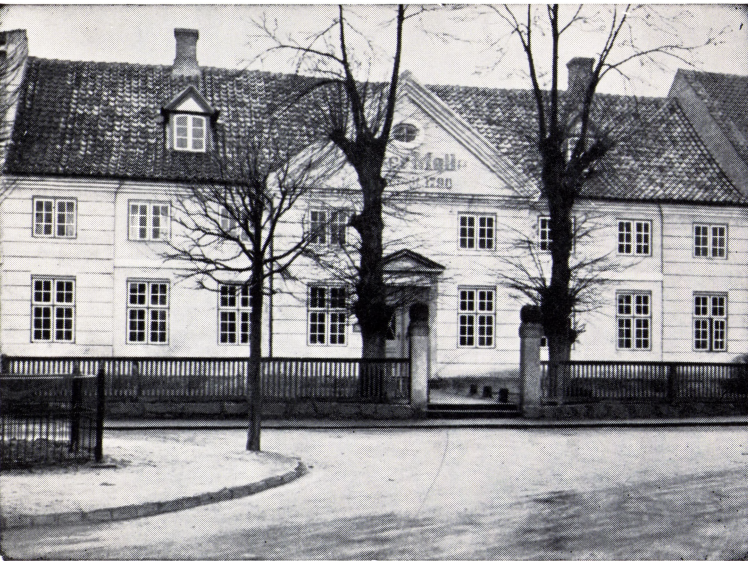
Vester Mølles hovedbygning. Opført 1790.